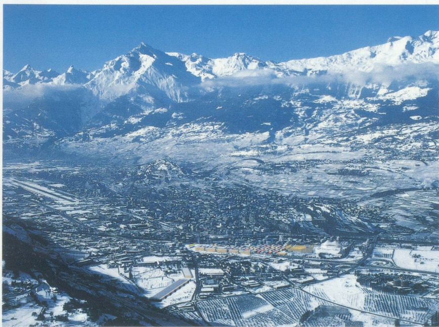
Vue aérienne de Sion en 2006 avec le quartier olympique en images virtuelles : le village, la patinoire, le stade des cérémonies (Tourbillon) et le parc médias.

Certains milieux de la population craignent toutefois qu'après ce feu d'artifice de quinze jours, il faille éliminer des montagnes de déchets et vivre dans un paysage défiguré à jamais par des lignes de béton. Pour qu'il n'en soit pas ainsi, le Comité a précisément chargé une commission de définir une « charte du développement durable » assurant à la région un essor économique, social et culturel qui s'inscrive dans le long terme et ne nuise pas au bien-être des générations futures. Avec son « Livre vert » et son « contrat nature », la candidature de Sion 2002 était déjà à l'avant-garde. Le CIO avait reconnu toute la valeur de sa démarche en faveur d'une organisation des Jeux aussi respectueuse que possible de l'environnement. Et ces efforts ont été aussitôt intégrés au cahier des charges des villes candidates. Le Comité « Sion 2006 » a voulu aller encore plus loin, en décidant de passer tous ses actes et ses réflexions au crible du « développement durable ». En mai 1998 fut donc signée la charte du même nom. Et pour bien montrer qu'il ne se contente pas de clauses de style, le