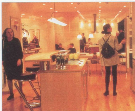
Le marché de l'information pour les architectes, les spécialistes du bâtiment comme pour les propriétaires et les artisans.

La foire de Bâle accueillera, du 2 au 6 février 1999, le salon suisse de la construction SWISSBAU. Avec près de 1000 exposants, ce salon est le plus important forum de l'industrie suisse du bâtiment et l'un des tout premiers salons de la construction en Europe. Cette année, l'accent sera particulièrement mis sur les secteurs de l'aménagement et de la domotique. 1362 exposants, venus de 30 pays, y présenteront sur 50.000 m 2 leurs dernières nouveautés dans les secteurs de l'aménagement, de la cuisine, du sanitaire, du jardinage, de la piscine, de la domotique, de la planification et de la communication. Au programme également des séminaires et conférences, ainsi que des présentations spéciales. Près de 100.000 visiteurs sont attendus. A noter que la Documentation suisse du bâtiment présentera, sur son stand E22, salle 211, une documentation complète (classeurs, CD-Rom, site Internet www.baudoc.ch ) sur l'ensemble du marché suisse de la construction. Pour tout renseignement sur Swissbau : Tél. +41 61 686 22 54 - Internet : http://www.messebasel.ch/swissbau .