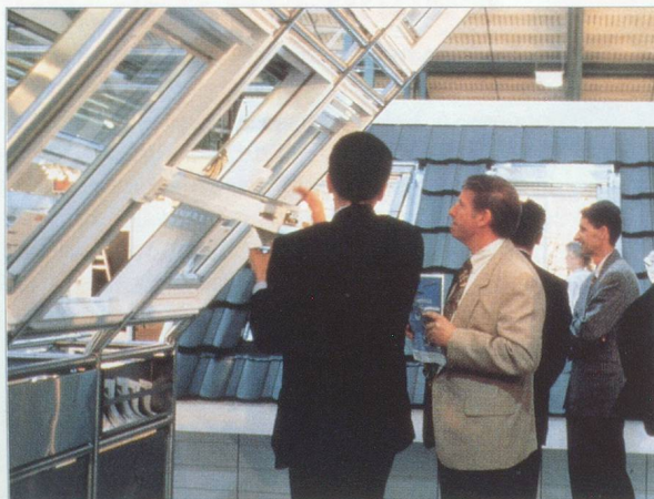
D'intéressantes présentations spéciales portant sur la construction et l'architecture enrichissent l'offre informative de Swissbau 99.