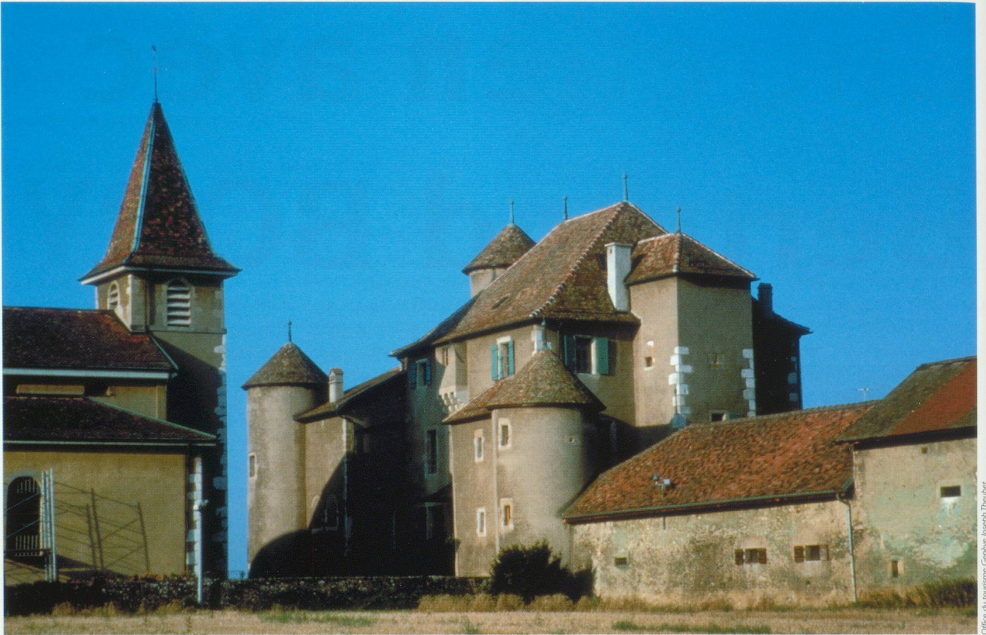
Château de Compsières

travaillé par le professeur Yves Flückiger, de l'Université de Genève). Depuis les accords de Ferri, en été 2000, stipulant l'obligation d'échanges d'informations entre les États membres de l'Union euro- péenne et des États tiers, telle la Suisse, concernant des comptes