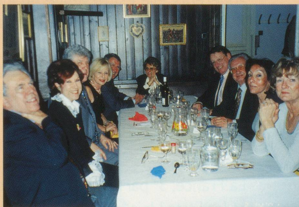
Une ambiance détendue.

opérateurs et leurs alliances. Pour tout savoir sur Eurecom : www.eurecom.edu .