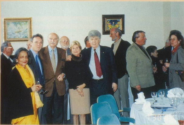
Vue de l'apéritif.