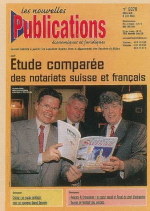
La CCSF fait la "Une"

Le notariat suisse se trouve à l'aube de bouleversements importants sous la pression de la libéralisation mais également sous l'influence d'une concurrence toujours plus vive des grands bureaux juridiques internationaux. D'où la nécessité d'apprendre à communiquer davantage avec la clientèle, tout en restant cependant profondément attaché à l'acte authentique qui fait sa spécificité.