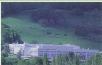
Serono Biotech Center

Depuis, le chiffre d'affaires du groupe a été multiplié par deux et le bénéfice par six à plus de 300 millions de dollars. La compagnie cotée à la Bourse suisse et au New York Stock Exchange, qui emploie désormais 4500 personnes dont 1200 à Genève, s'est taillée une place de choix dans l'univers des biotech, notamment grâce au Rebif, son médicament vedette contre la sclérose en plaque. Ses domaines de recherche, pour lesquels le groupe consacre près de 25% de son chiffre d'affaires, s'étendent également à l'arthrite rhumatoïde ou psoriasique et à l'infertilité, en passant par l'hépatite C, le diabète et le cancer de la prostate. L'année 2002 a d'ailleurs été riche en développements grâce à des accords conclus avec les plus grandes entreprises de la branche comme Pfizer, Amgen et Genentech, grâce également à la reprise du laboratoire français Genset pour 160 millions de francs. Cette société ouvre à Serono d'importantes perspectives dans la génomique et la découverte de nouvelles cibles thérapeutiques. Dans le bassin lémanique, Serono est devenu un modèle de réussite technologique qui n'a pas fini de faire des émules.