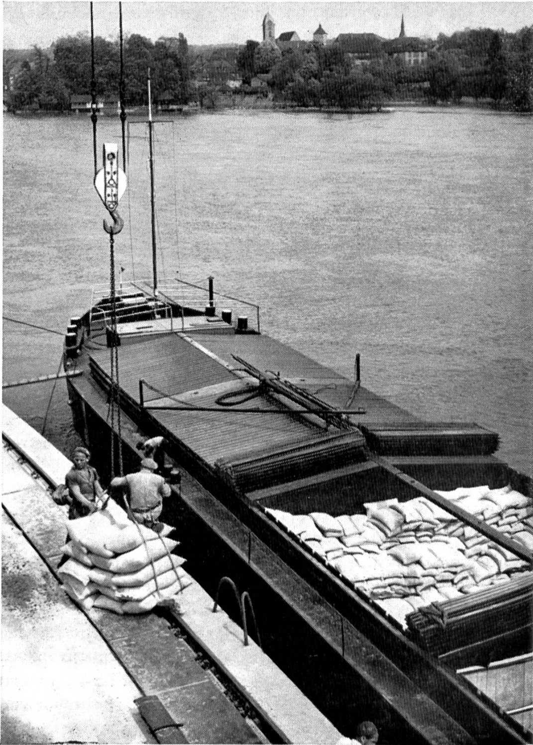
Schleppkahn im Hafen von Rheinfelden/Baden