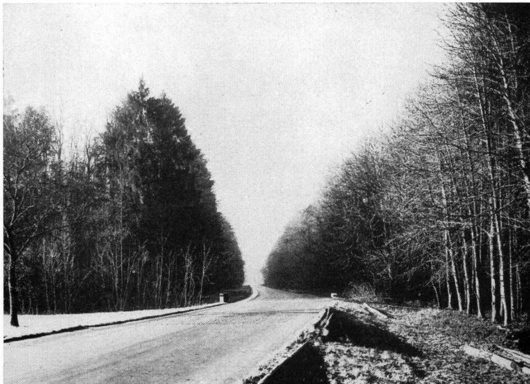
Abb. 2. Am Augsterstich