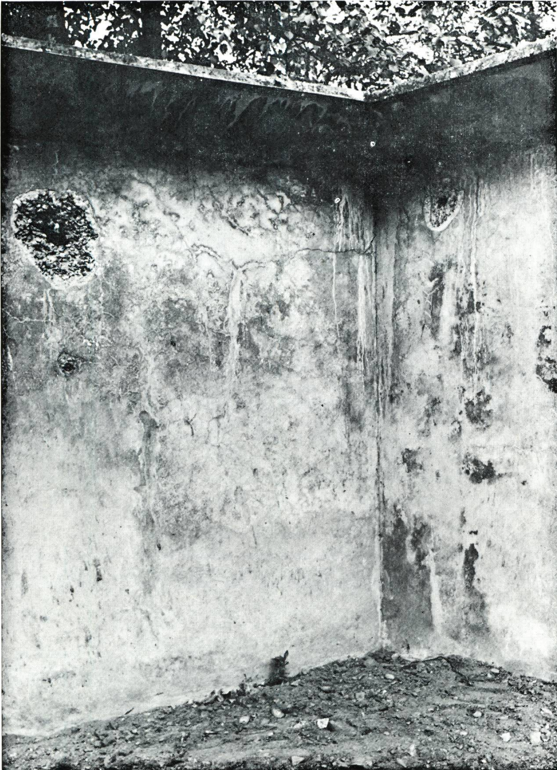
Der Mauerwinkel mit Loch 1 (links) und Trichter 2 (rechts).