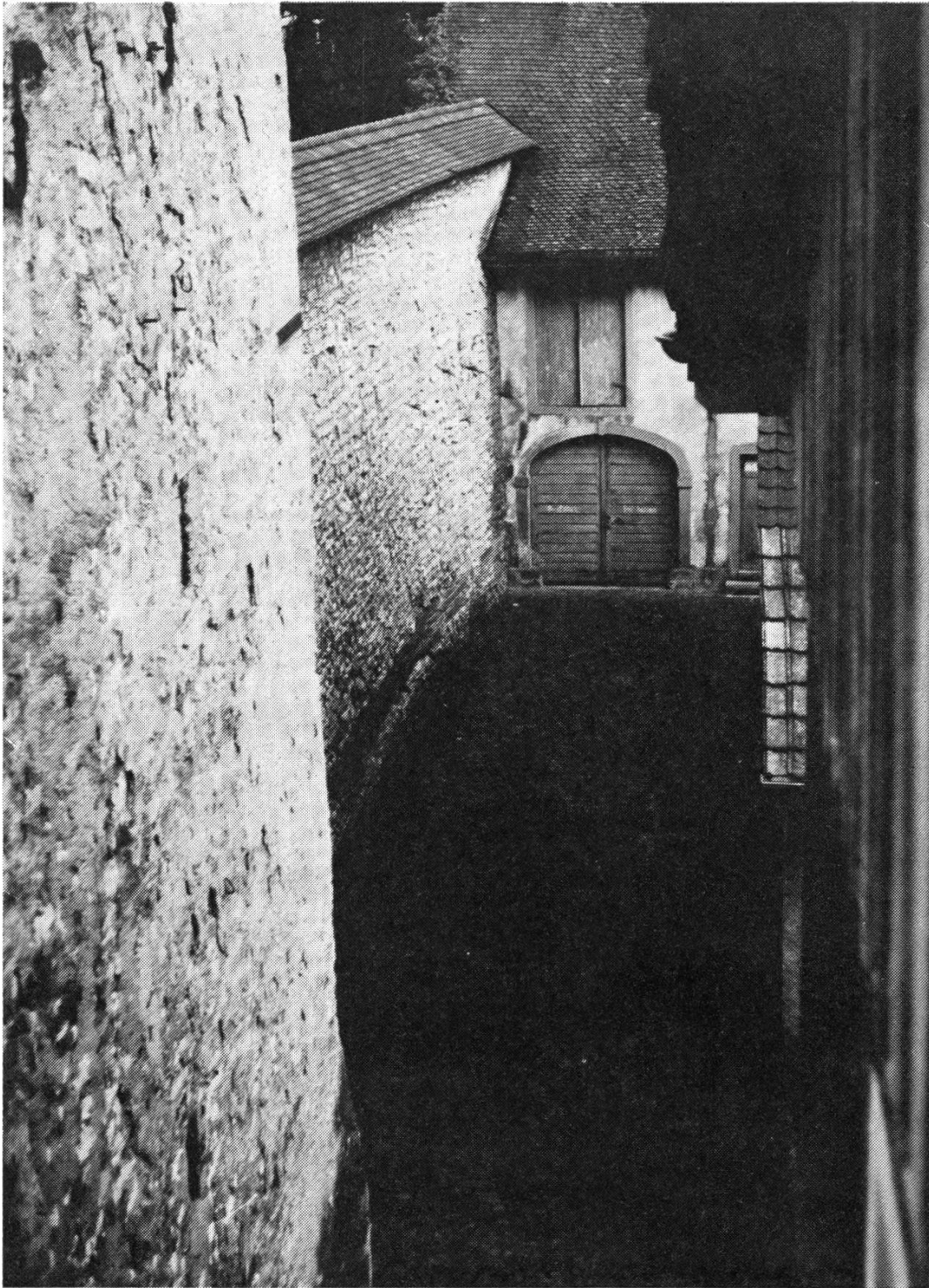
Fotowettbewerb EZA 2. Preis (M. Hahn, Magden)