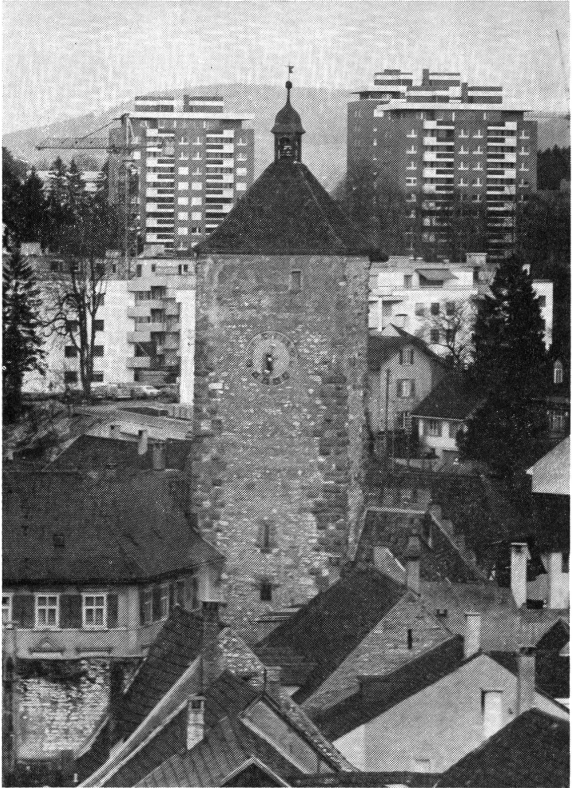
Fotowettbewerb EZA 3. Preis (R. Baumann-von der Crone, Magden)