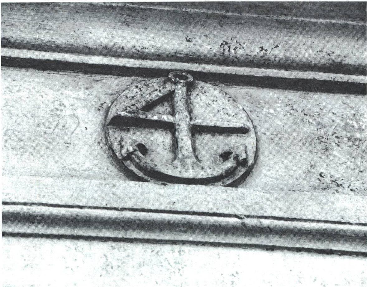
Familienwappen der Familie Perrollaz an der Marktgasse 23, Haus «Zum weisen Sarken».