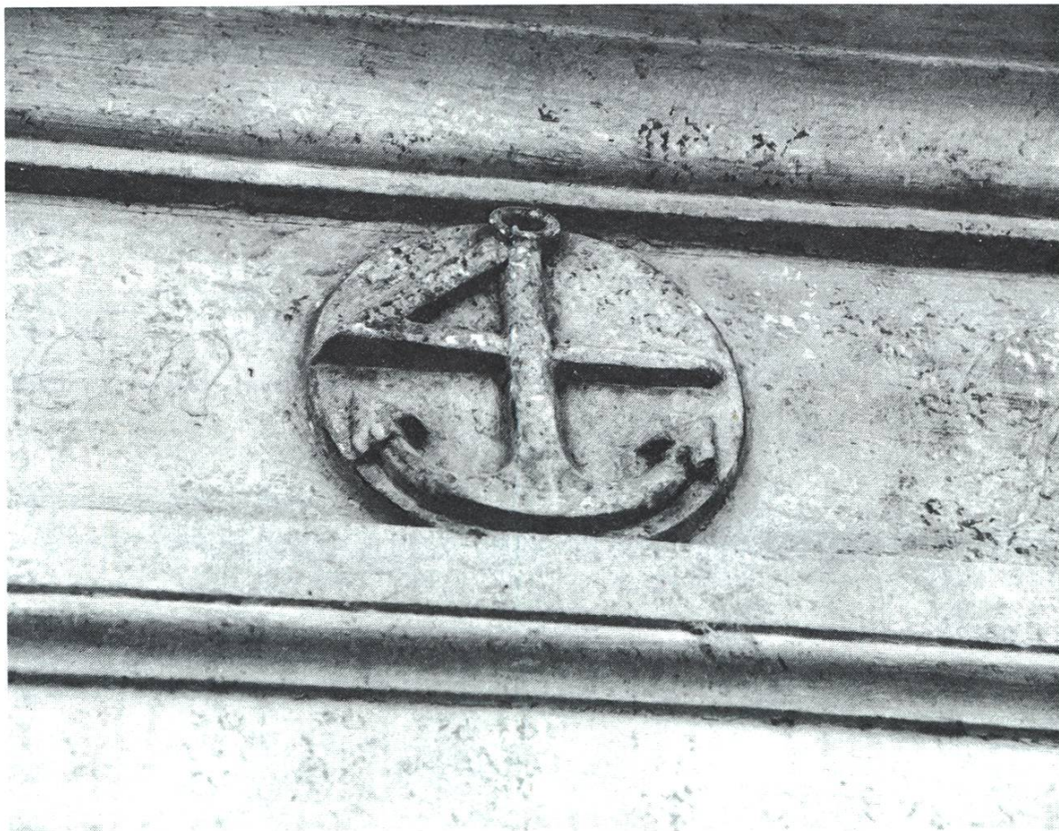
Familienwappen der Familie Perrollaz an der Marktgasse 23, Haus «Zum weisen Sarken».