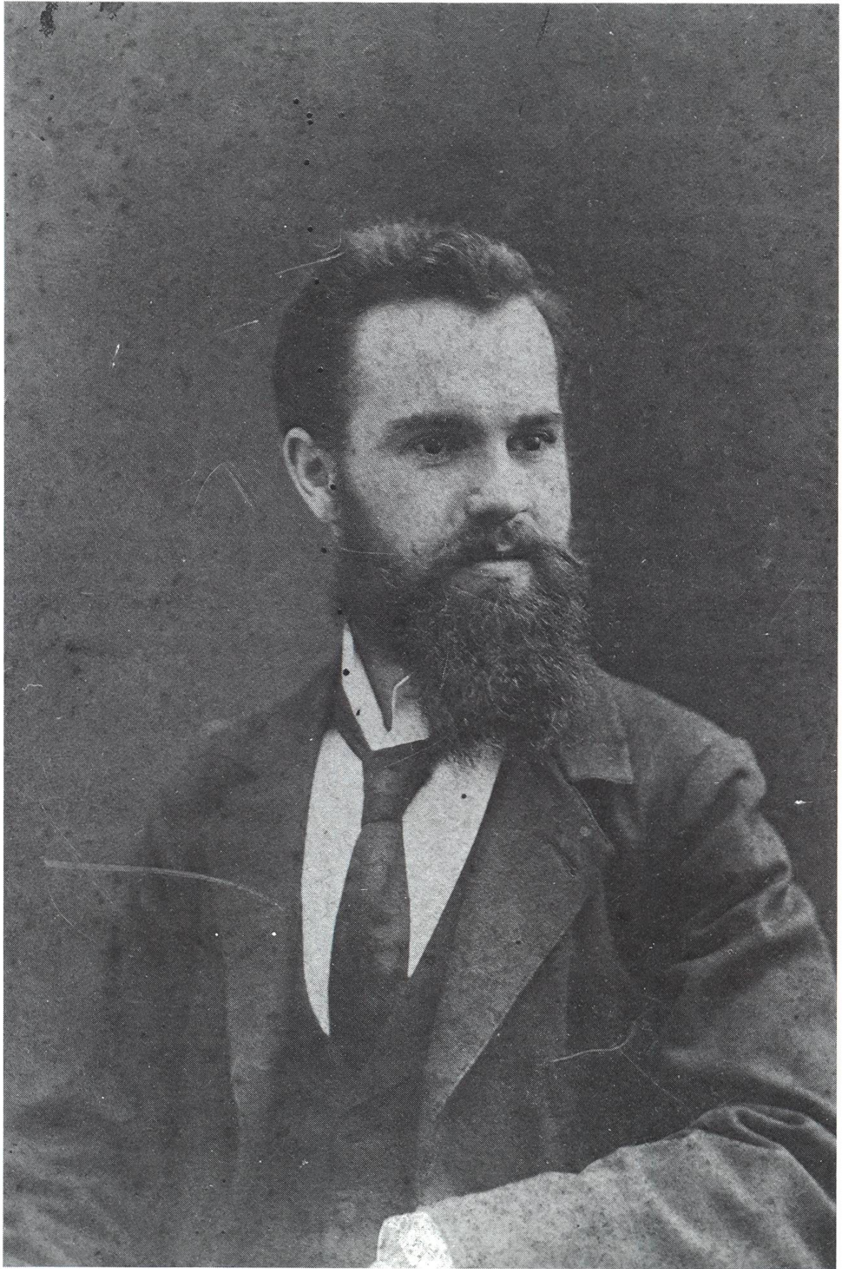
Gustav Adolf Welti im Jahre 1901.