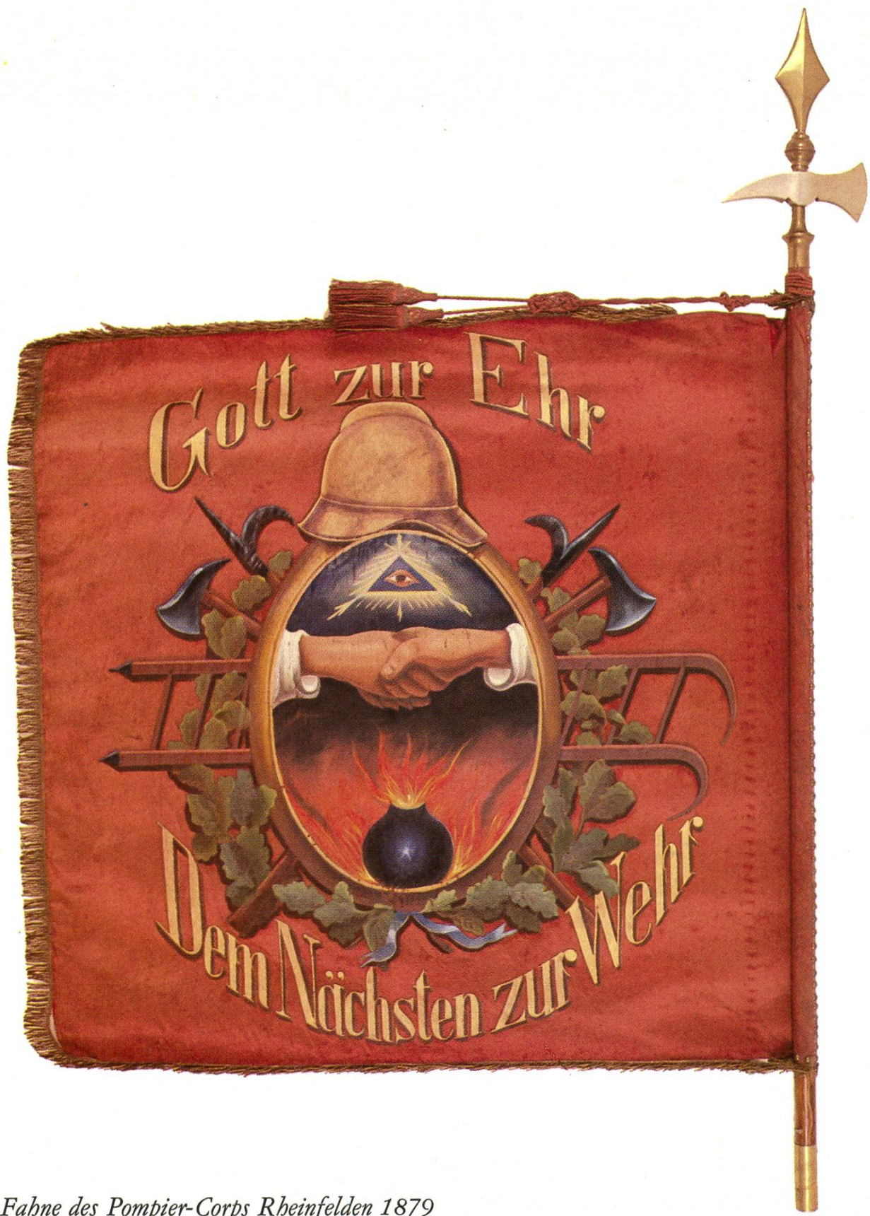
Fahne des Pompier-Corps Rheinfelden 1879