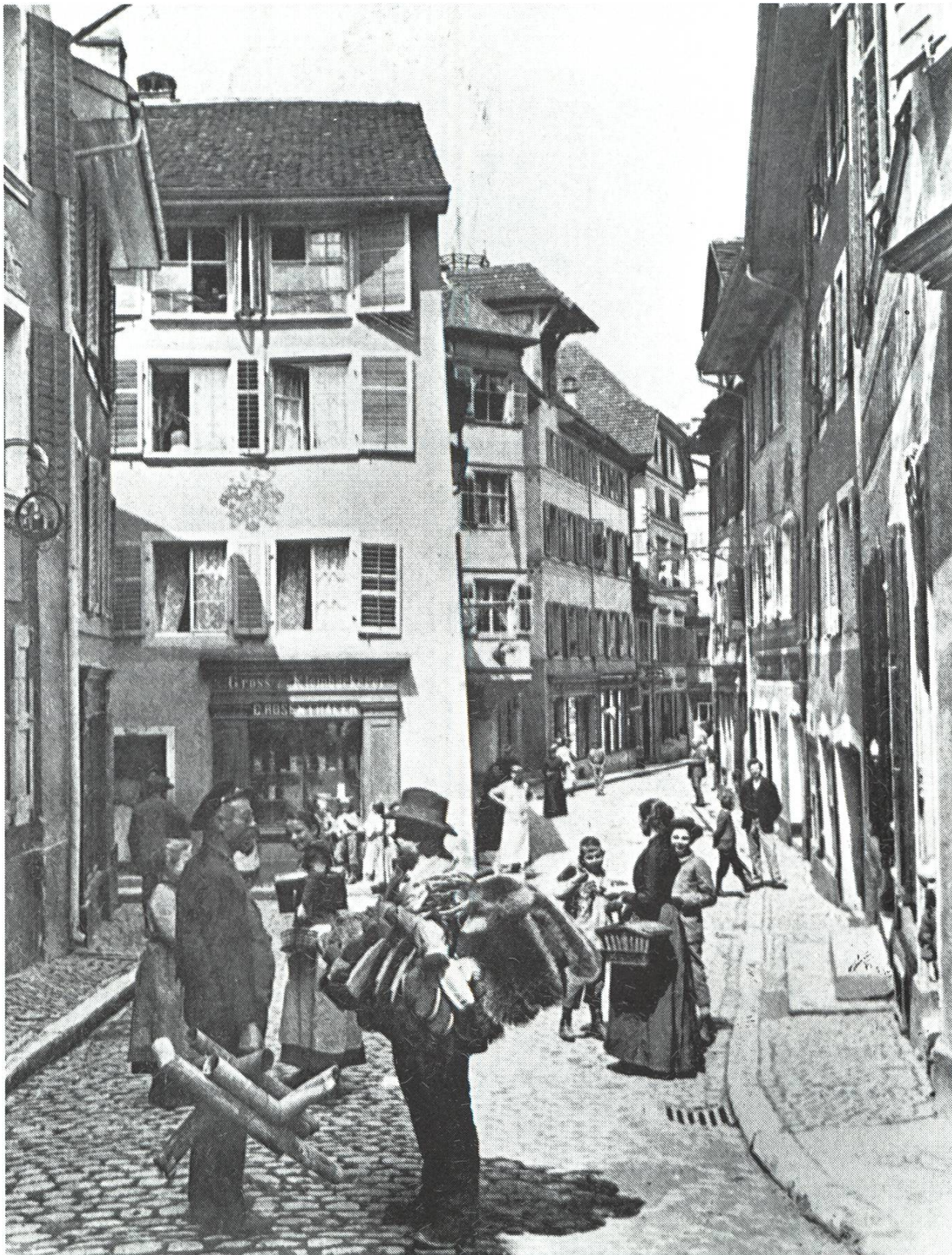
Brodlaube zirka 1900, Foto J.E. Baumer. Fotosammlung Fricktaler Museum, Rheinfelden. Häuser und Geschäfte waren damals noch fest in der Hand alter Bürgergeschlechter, wie z.B. hier die Bäckerei Rosenthaler (heutige Bäckerei Jegge). Im Vordergrund ein Spengler und ein Hausierer mit Bürstenwaren, links die Wirtschaft «Zum Heidewybli».