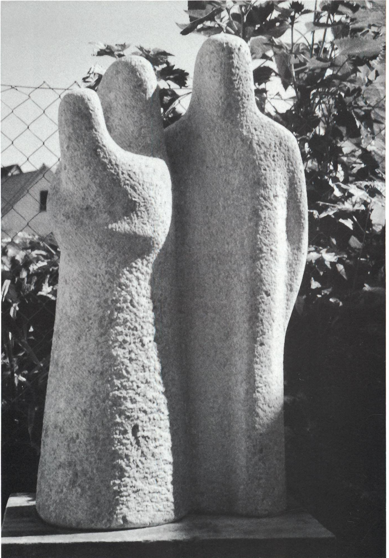
Waldfamilie (1938), Stein