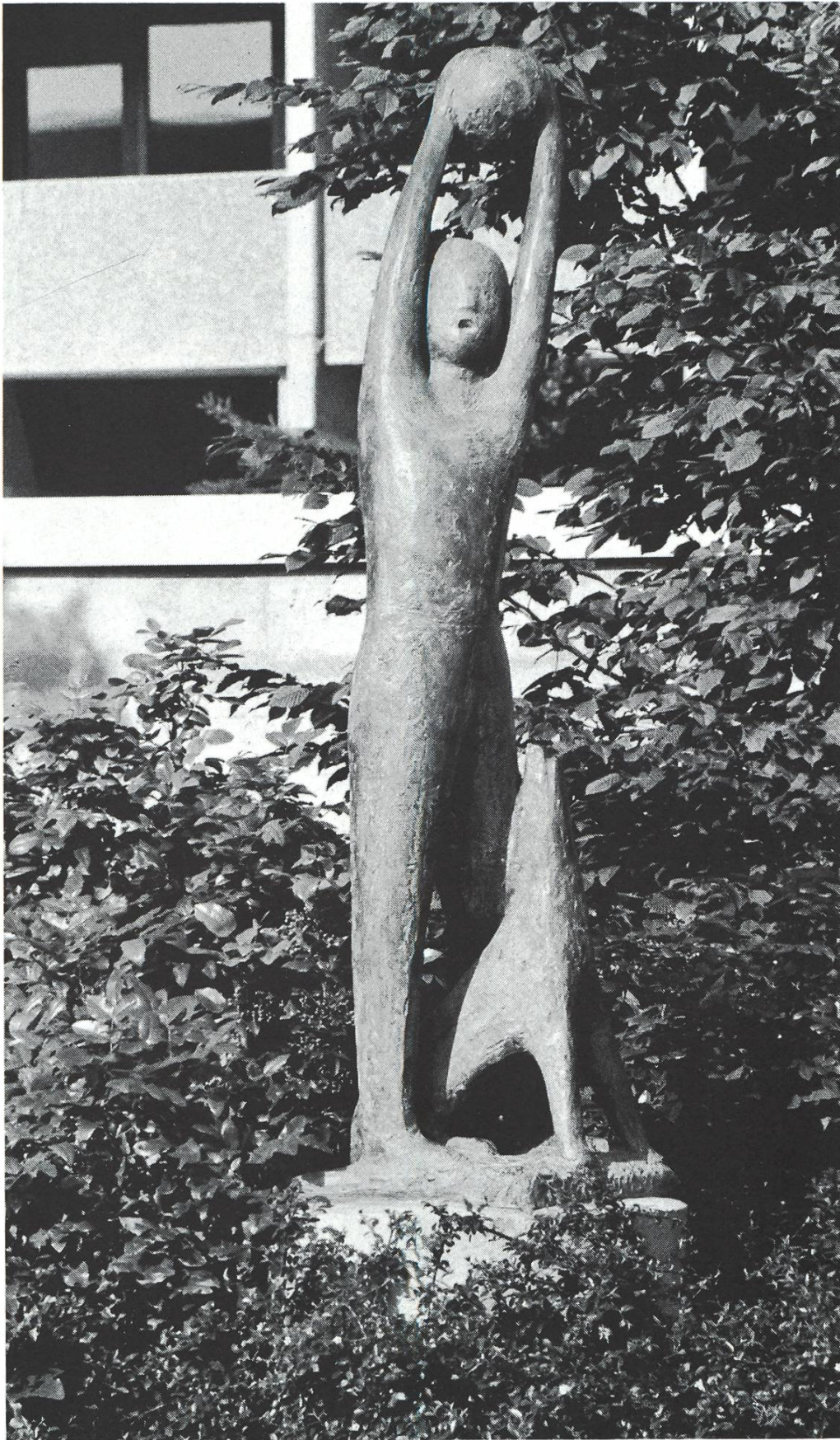
Die Spielenden (1971), Bronze.