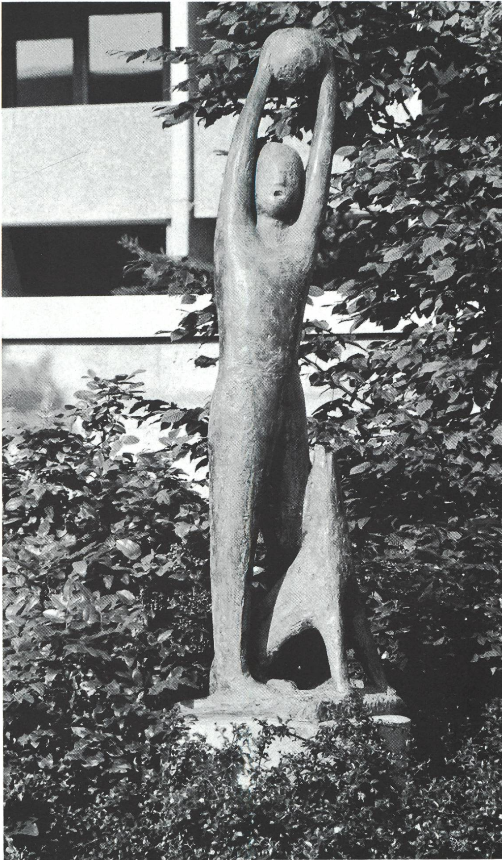
Die Spielenden (1971), Bronze.