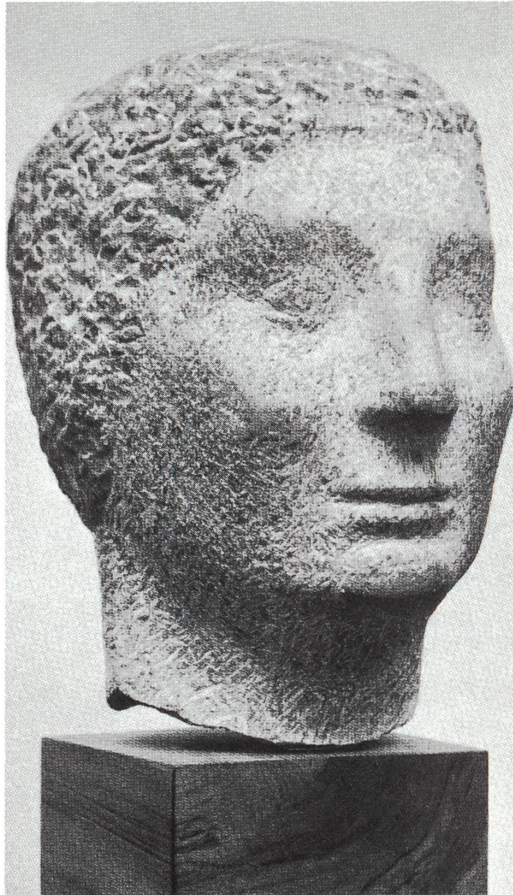
Fauenkopf (1932/1960), Stein