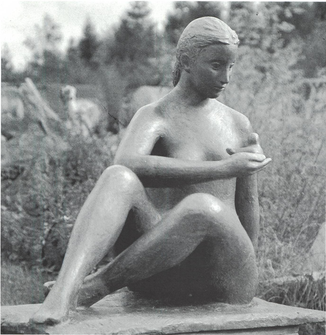
Friedensbotin (1951), Bronze.