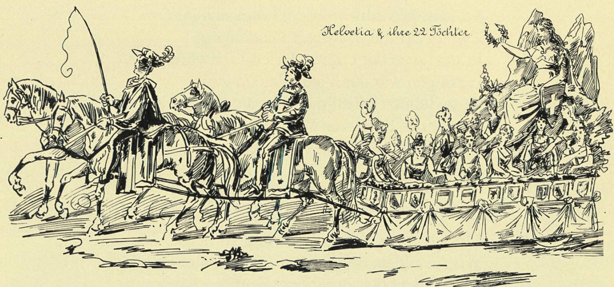
Ausschnitt des Posters: Bilder aus der Geschichte Rheinfeldens. Sonderbeilage der Neujahrsblätter 1992

Geb' Gott dem Volke langen, reichen Segen, Wir bringen ein Willkommen euch entgegen Und Alle sind mit Herz und Hand bereit Zu leisten den verfassungsmäss'gen Eid! — (Die Huldigungsformel wird verlesen und der Eid geleistet.)