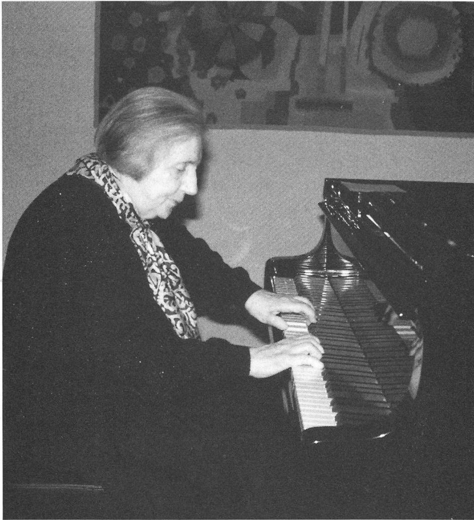
Die Pianistin in ihrem letzten Konzert