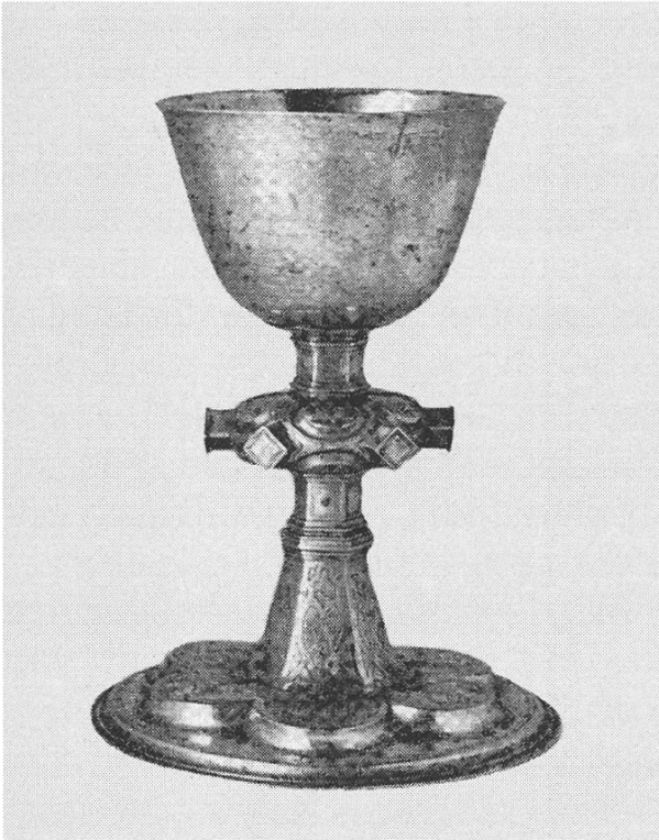
Kelch aus dem Stiftsschatz von St. Martin um 1600