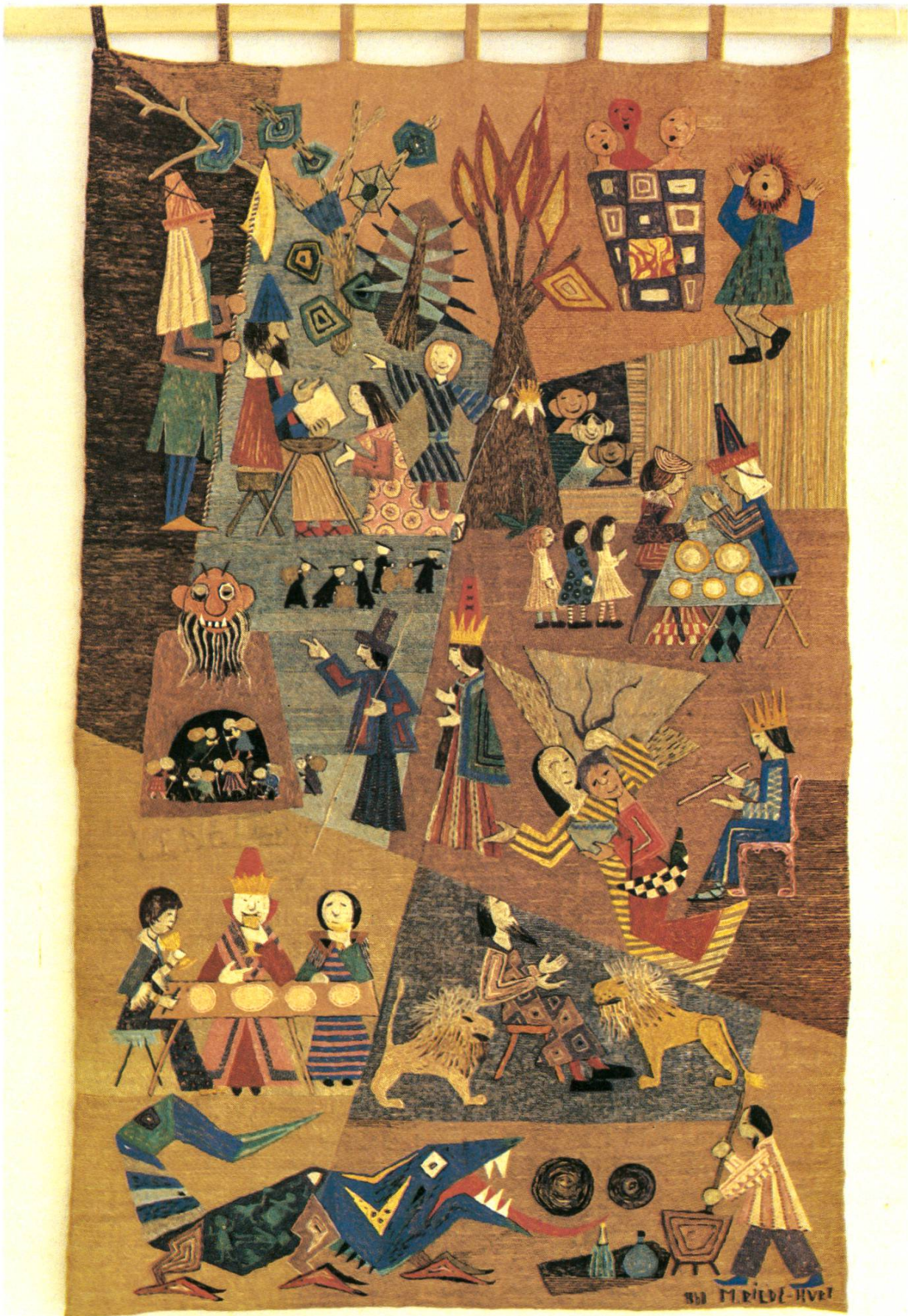
Daniel, der Prophet, 1960