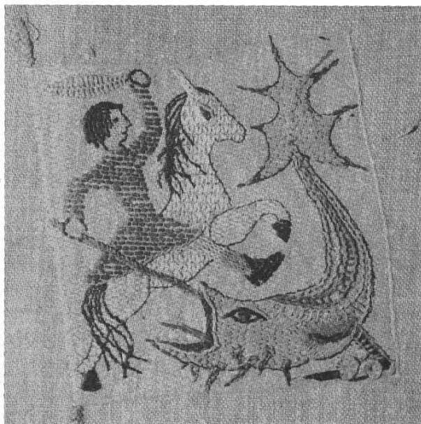
Vier-Waldstädter- Behang II, Detail

In ihren Stickereien hat die Künstlerin die verschiedensten abstrakten und konkreten Motive gestaltet. Die Fricktaler Landschaft, vor allem das Dorf Mumpf und seine Umgebung, Gewässer mit Booten, ausgeworfene Netze, Fischer, immer wieder eine Anglerin auf einem Turm 5) , Brücken, Türme und Tore kommen häufig vor. Menschen in Gruppen, Fricktaler Dorforiginale oder weltpolitische Figuren tummeln sich in Alltagsszenen, veranschaulichen politische Ereignisse, feiern religiöse Feste oder machen eifrig bei Volksbräuchen mit (z.B. Basler Fasnacht, Fricktaler Feste, Brauchtum der vier Waldstädte). In Zaubergärten blühen Traumblumen. Daneben zeugen religiöse Motive von Frau Riedes starkem Glauben. So erscheint z.B. der Prophet Daniel auf einem Wandbehang in Rheinfelder Privatbesitz. Die vier Evangelisten schmücken eine von Frau Riede entworfene und vollendete Abendmahlsdecke der reformierten Kirchgemeinde Kaiseraugst. Sehr eindrücklich gestaltet ist auch Bruder Klaus auf dem Bildteppich in der Bruder-Klaus-Kirche Spiez. Diesen bodenständigen und zugleich mystischen Heiligen hat Frau Riede tief verehrt.