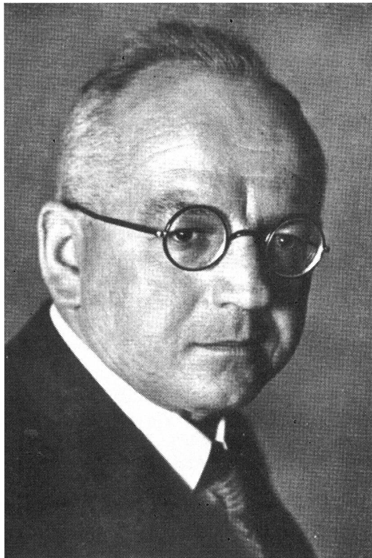
Anton Senti, 1887 bis 1966

5. Juli: Die Ortsbürgergemeinde entspricht mit grosser Mehrheit einem Subventionsgesuch von A. Senti und E. Bröchin. Bewilligt wird ein fester Beitrag von Fr. 300.-. Dies entgegen dem ursprünglichen Vorschlag der Waldkommission, der vorgesehen hatte, dass “sämtliche nutzungsberechtigten Bürger und Bürgerinnen Abonnenten der Neujahrsblätter werden [sollen]. Der Abonnementsbetrag wäre jedem Nutzungsberechtigten an der Barentschädigung des Bürgernutzens ... abzuziehen.” (!)... “Für einmal sollte die Ortsbürgergemeinde maximal Fr. 300.– ... zusichern. Für die Zukunft aber dürften solche Zuwendungen kaum mehr in Frage kommen, da die Belastungen durch Staats- und Bundessteuern ein derartiges Ausmass angenommen haben, dass aus dem Wald für nicht forstliche Zwecke keine Gelder mehr erübrigt werden können.” (!)