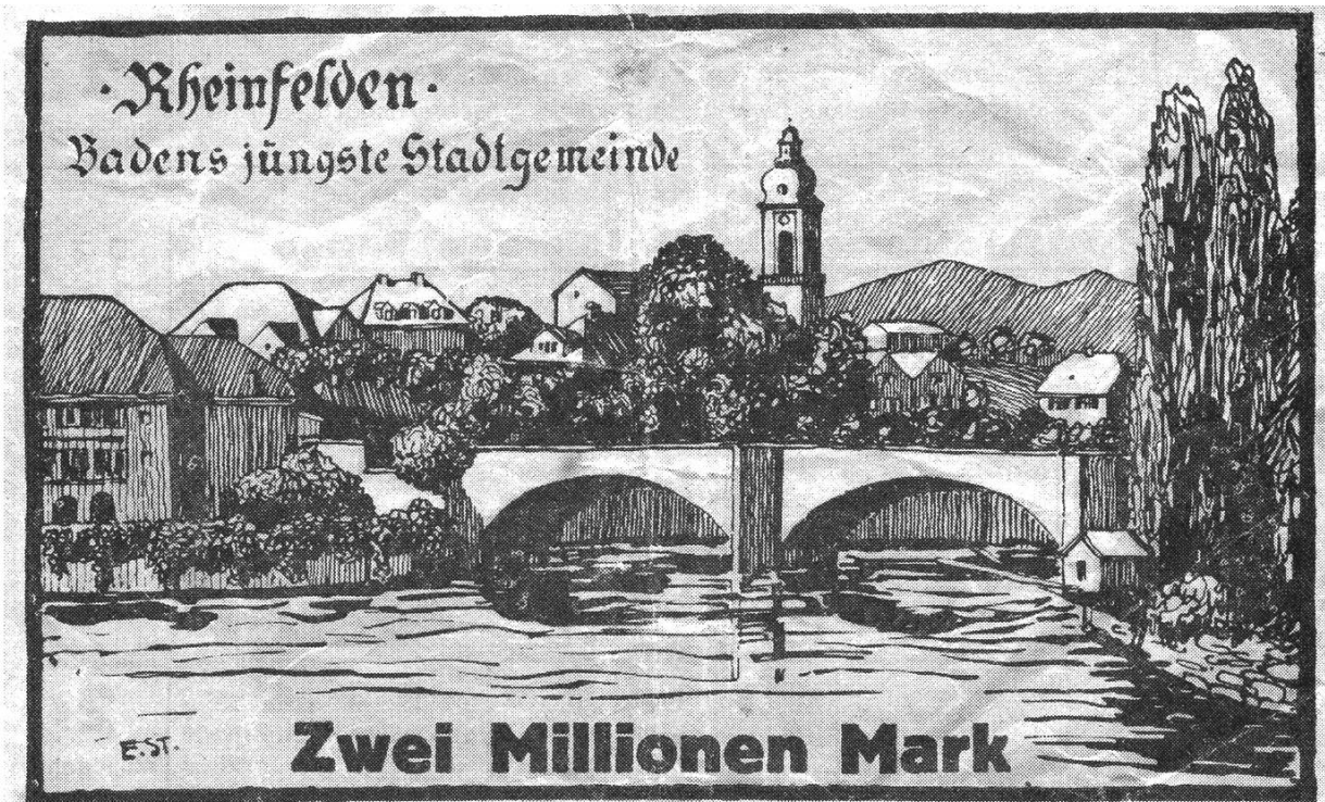
Deutscher Geldschein von 1923 über 2 Mio. Mark aus der Zeit der Inflation. Die grenzüberschreitende Rheinfelder Brücke. Am Bildrand links das Haus Salmegg, rechts das schweizerische Inseli. Hinten die St. Josephs-Kirche in Badisch Rheinfelden