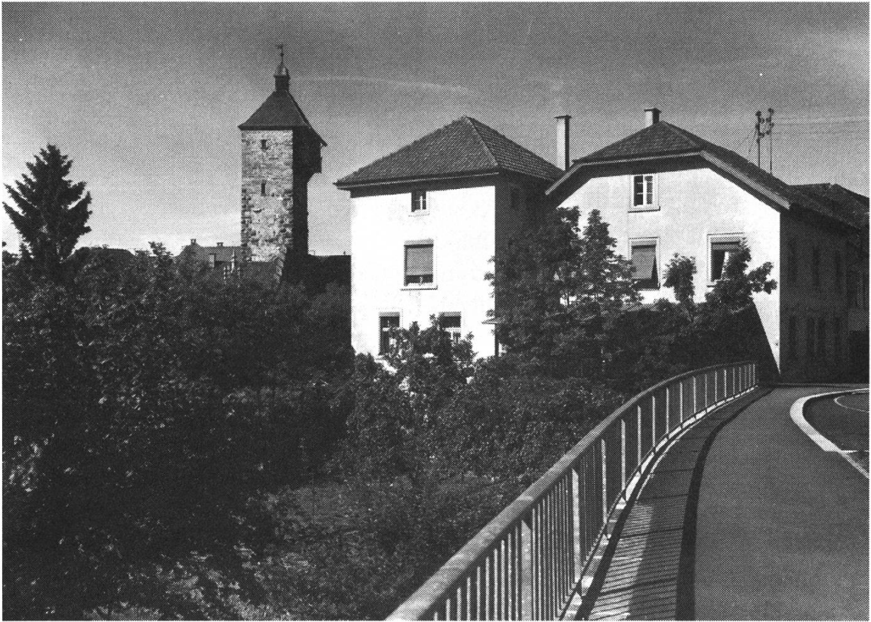
VII. Ehemaliger Garten der Villa L'Orsa. Im Hintergrund das von Emil Baumer erbaute Haus mit Wohnturm.