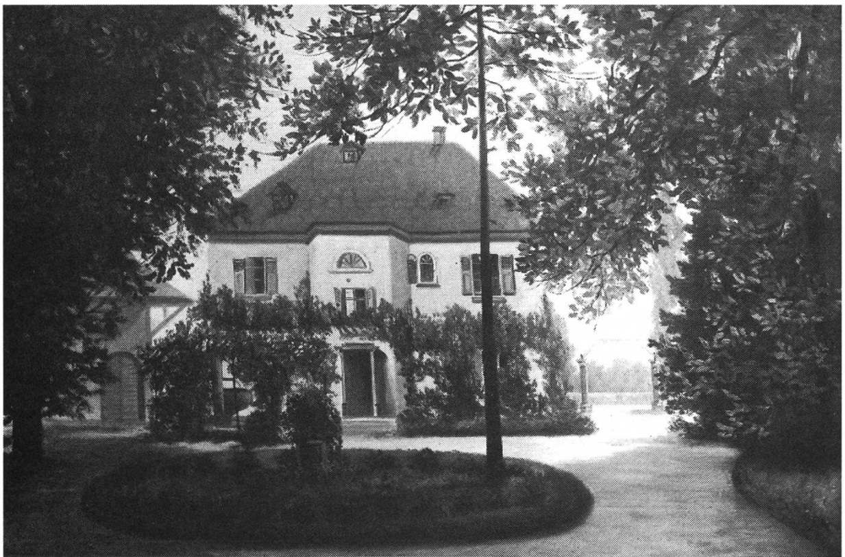
IV. V. Villa L'Orsa von J. Stahel. Öl auf Leinen, 72 x 51 cm, 1919. Geschenk von Familie H. Brun an das Fricktaler Museum