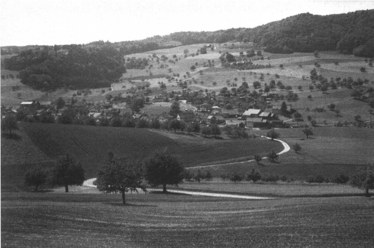
Oberhofen im Mettauertal

Dieser Pilotversuch im Fricktal ist von gesamtschweizerischer Bedeutung. Vor allem soll diese Studie, zusammen mit dem im Kanton bereits erprobten System der Flächenbeiträge auch als Versuchsobjekt für den Bund dienen. Kernstück bildet die Integration umweltpolitischer und agrarpolitischer Aspekte. Dies ist nur möglich, wenn die Konfrontation durch Zusammenarbeit ersetzt wird.