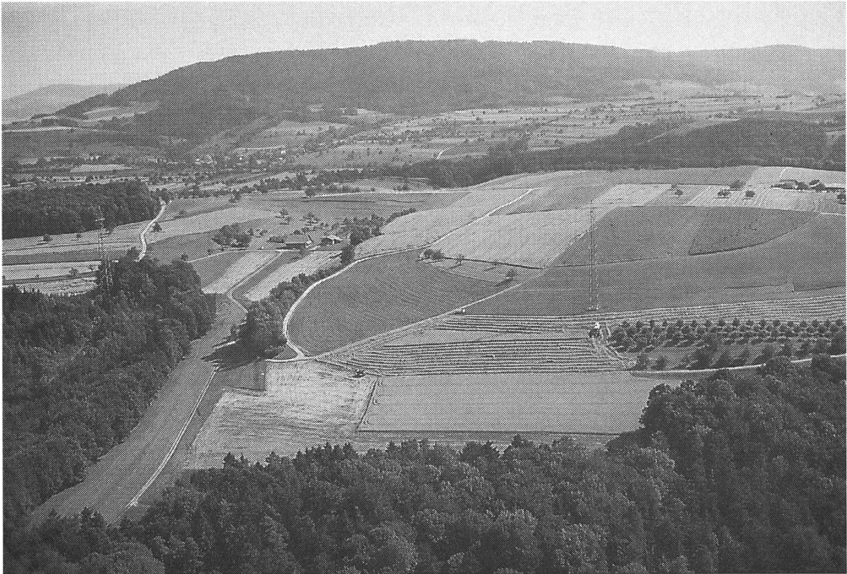
Blick aus Richtung Mumpferflue nach Süden zum Tiersteinberg mit Schupfart

Hochstamm-Kirschbäumen in jüngster Zeit aus arbeitstechnischen Gründen auch stark rückläufig ist, so spielt der Anbau dieser Spezialkultur für viele Landwirte im Fricktal immer noch eine bedeutende Rolle. Bei der Baumzählung 1991 wurden folgende Bestände ermittelt: