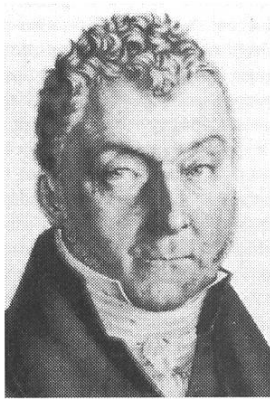
Ignaz Paul Vital Troxler (1780-1866)