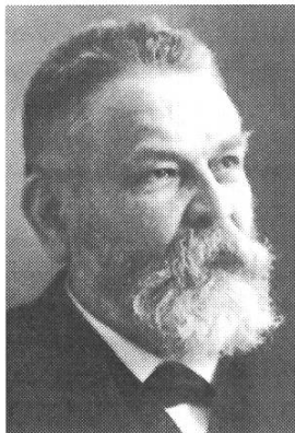
Emil J.R. Frey (1838-1922)

Der Sonderbund der katholischen Kantone der Schweiz, der im Sonderbundskrieg von 1847 unterlag, hatte Parallelen zum späteren amerikanischen Bund der Konföderierten (Südstaaten) und dessen Besiegung im Sezessionskrieg. Der schweizerische Bundesstaat von 1848 kopierte das US-Modell von 1787, an erster Stelle das Zweikammersystem: den Ständerat entsprechend dem US-Senat, den Nationalrat entsprechend dem US-Repräsentantenhaus. Einer, der am intensivsten die Übernahme der US-Verfassung durch die Schweiz propagierte, war Ignaz Paul Vital Troxler (1780-1866). Troxler, in Beromünster LU geboren, studierte ab 1800 in Jena und Wien Philosophie, Naturwissenschaft und Medizin. Er wirkte als Philosophieprofessor in verschiedenen Städten Deutschlands und der Schweiz, wo er zäh gegen Aristokratentum und Reaktion kämpfte. Er wurde 1831 Rektor der Universität Basel, musste aber die Stadt fluchtartig verlassen, weil er für Baselland Partei ergriffen hatte. In Aarau war er daraufhin als Mittelschullehrer und Arzt tätig und wurde 1832 Grossrat, 1834 Professor der Philosophie an der Universität Bern. Er war ein hervorragender Vordenker der Anthroposophie von Rudolf Steiner. Er starb in Aarau. 28