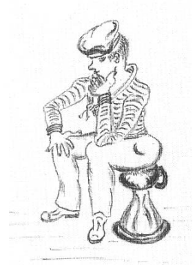
Vignette von G.O. Hausmann zum Gedicht «Rüste, mein Schiff, so rüste!», 1951.

C.P. 3 = offizielle Bezeichnung für: Compagnie de passage, Caserne Prud'homme, Gebäude 3.