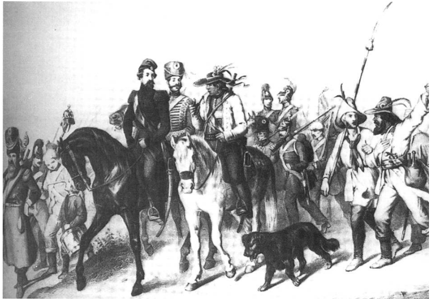
Rückzug der Republikaner im Juli 1849.