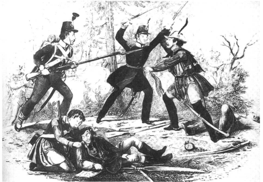
Das Ende der Legion des Dichters Georg Herwegh in Niederdossenbach am 27. April 1848.

Alter: 32 Jahre; Grösse: 5'5"; Statur: schlank; Haare: braun; Augen: braun; Nase: spitz; Mund: mittler; Gesichtsform: länglich; Gesichtsfarbe: gebräunt; Bart: trug bei seiner Entfernung einen braunen Schnurrbart. 10