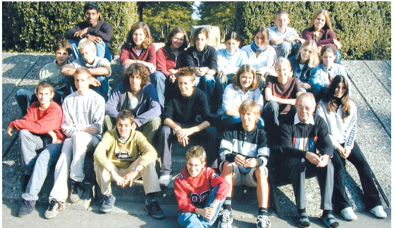
Die Klasse 3c.

Die Umfrage wurde von den Klassen 3a und 3c am 26. Juni