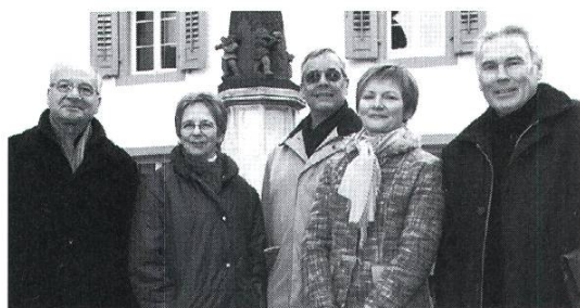
Der Stiftungsrat des Behinderten- fahrdienst Rheinfelden

2006 reichlich geflossenen Spenden finanziell sehr gut da steht. Damit ist der Betrieb des BFD für die kommende Dekade in finanzieller Hinsicht gesichert, und es sollte auch weiterhin möglich sein, die Mobilität behinderter Mitmenschen zu sozial verträglichen Preisen zu gewährleisten.