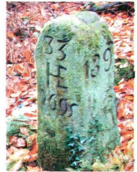
Grenzstein im «Horndlesehölzli», Jahrzahl 1695, Kennzeichen HE für Heflingen.

«Neui Welt» im Osten und «Güeterbüel» im Westen abschreitet, findet einige der ältesten Grenzsteine der Nordwestschweiz überhaupt. 34 Neben den vier schon erwähnten Steinen mit der Jahrzahl 1561, finden wir im Brand einen Stein von 1605 mit Rheinfelder Wappen. Ein abgebrochener Stein mit Wappen von 1626 wurde leider bei der letzten Grenzvermessung vom ausführenden Personal entfernt und vernichtet! Im Güeterbüel finden wir neben einander einen Stein mit Jahrzahl 1694 und zwei mit Jahrzahl 1695. Alle drei sind mit den Initialen HE (Heflingen) gekennzeichnet und wurden im Rahmen der erwähnten Banngrenzen-Erneuerung von 1695 gesetzt. Zwei Steine im Horndlesehölzli bzw. zuoberst im Güeterbüelgraben tragen die Jahrzahl 1777 und die Initialen HEF. Beim ersten handelt es sich um den Ersatz des schon 1558 erwähnten historischen «langen Marchsteins». Leider ist er kürzlich abgebrochen. Er ist von einem Steinmetzen restauriert worden und wird künftig im neuen Magdener Gemeindehaus ausgestellt sein. Der jüngste Stein mit Initialen HE stammt aus dem Jahr 1793 und steht in der Brandholde ob der Rheinfelderstrasse. Er belegt, dass Höfingen als Bann bis in die Zeit der Helvetik weitergelebt hat. Der in der zeitlichen Abfolge nächste Stein aus dem Jahr 1812 steht im Junkereholz oberhalb Wachtlete und ist nun mit RF (Rheinfelden) und nicht mehr mit HE bezeichnet.