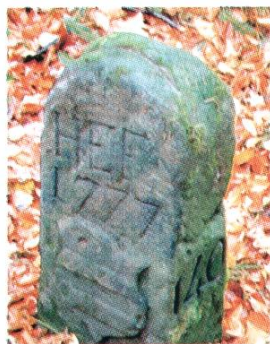
«Langer Marchstein» im «Horndlesehölzli», Jahrzahl 1777, Kennzeichen HEF für Hefflingen und Rheinfelder Wapen (der Stein wurde im Jahr 2000 bei Waldarbeiten beschädigt und ersetzt).