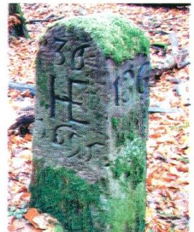
Grenzstein im «Güeterbüelgrabe», Jahrzahl 1695, Kennzeichen HE für Heflingen.

Bild Seite 165: Höfingen zwischen Rheinfelden und Magden links des Magdener Bachs. Ausschnitt aus dem «Grenzplan Basel-Österreich» (1602) von M.H. Graber (Staatsarchiv BL, KP 5001 0004).