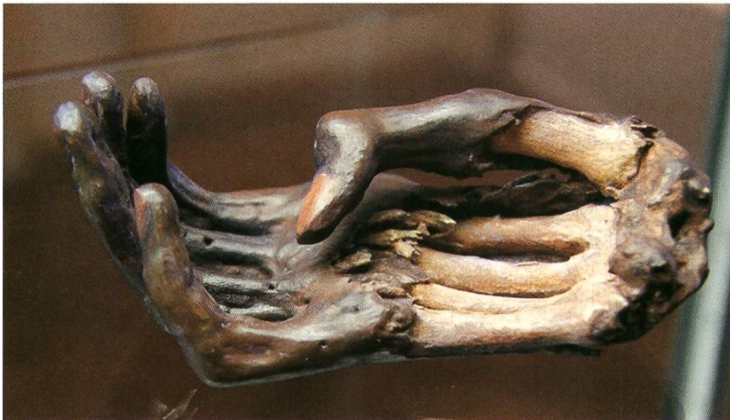
Das Replikat der abgeschlagenen Schwurhand König Rudolfs im Fricktaler Museum.