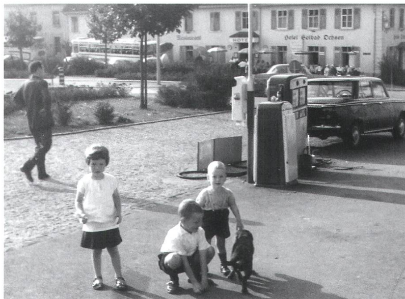
Garage mit den davorstehenden Zapfsäulen.