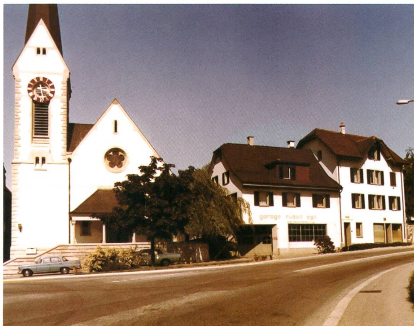
Das Grundstück Zürcherstrasse 1 neben der reformierten Kirche.

Für den weiteren Geschäftserfolg waren dann vor allem zwei Faktoren entscheidend: