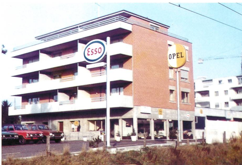
Das Wohn- und Geschäftshaus an der Zürcherstrasse 7.

1972 fand der Umzug in das neue grosszügige Betriebsgebäude statt. Die alte Liegenschaft «Zürcherstrasse 1» verblieb in Familienbesitz und wurde später vollständig renoviert.