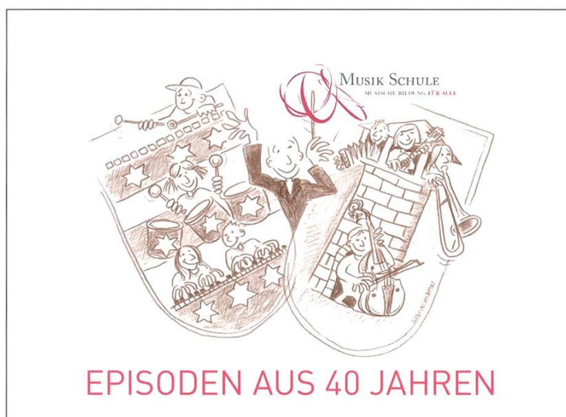
Titelbild der Jubiläumsschrift 40 Jahre Musik- schule Rheinfelden/ Kaiseraugst

Der Wert der Institution Musikschule, insbesondere im Blick auf ihre Geschichte, ist unbestritten. Dennoch fällt es oft schwer zu bemessen, wie viel Gewicht dieser Wert haben soll. Zu wenig konkret und individuell messbar seien die Erfolge. Angesichts dessen, dass viele Probleme heute unüberschaubar und komplex und wohl auch erst in der Zukunft