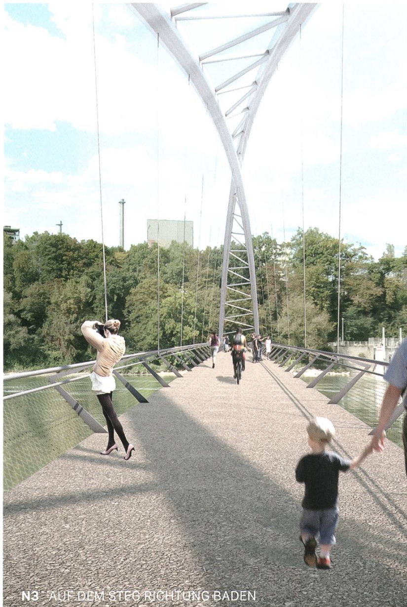
N3 AUF DEM STEG RICHTUNG BADEN

Bei diesem Projekt besteht das Brückentragwerk in Stahlbauweise aus sich kreuzenden, aber konstruktiv miteinander verbundenen Bögen. Die Jury fand diese Konstruktion beliebig.