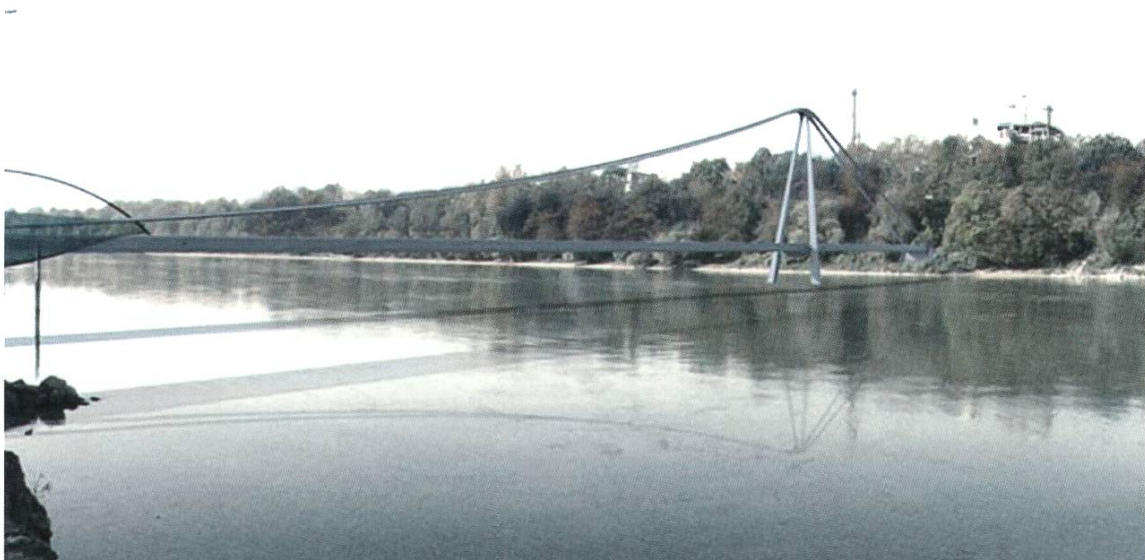
Eine asymmetrische Hängebrücke mit einem im Fluss stehenden Pylon: «Das Bauwerk ist von ausserordentlicher Filigranität und fügt sich harmonisch in die Landschaft», hält die Jury fest. Dieses Projekt wird mit einem Ankauf (20 000 Franken) gewürdigt.