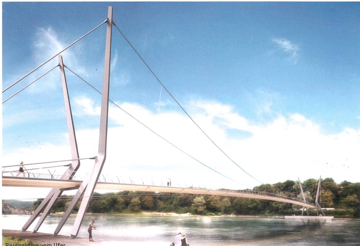
Der Sieger: Dieses Projekt überzeugte die Jury am meisten.