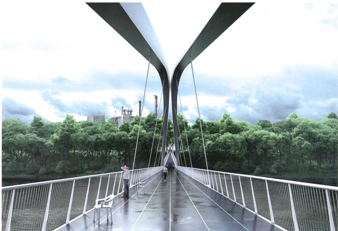
Den 2. Preis geholt: Die Jury fand die Stahlkonstruktion aussergewöhnlich und sehr elegant.