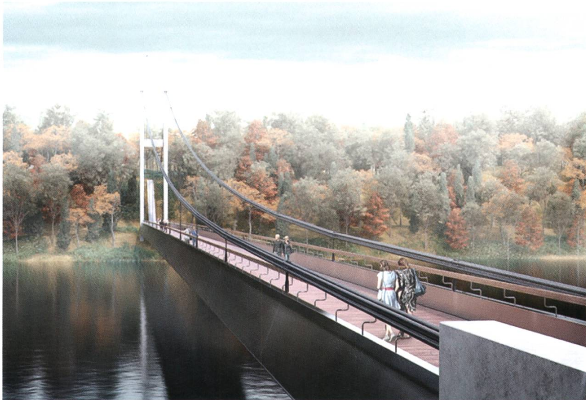
Den 3. Preis geholt: Eine einseitige Hängebrücke mit zwei Seilebenen und einem niedrigen Pylon in Stahlbauweise.