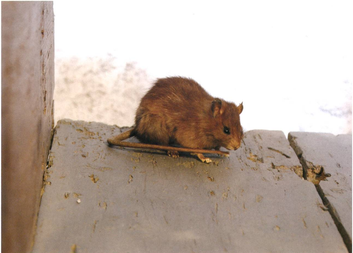
Die kleine Ratte