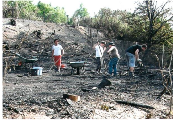
Der Brand zerstörte die Hüttenstadt auf dem Robispielplatz vollständig.