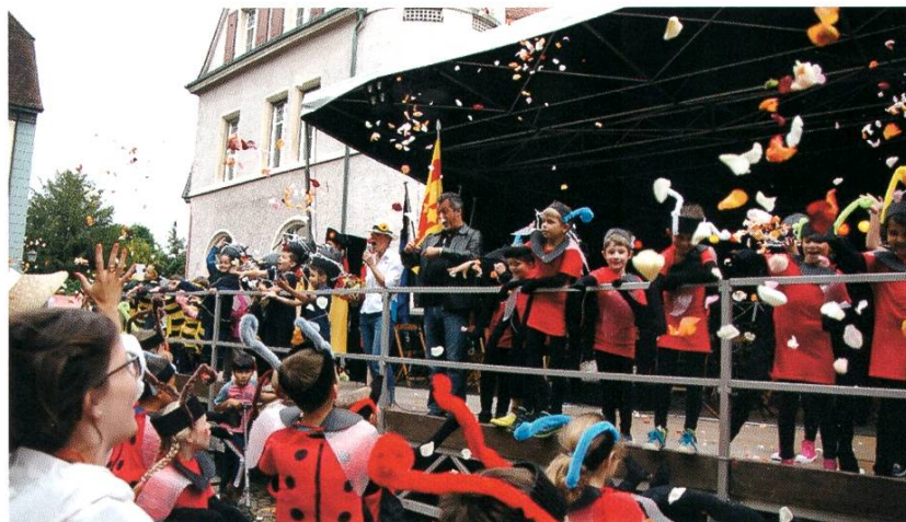
Jugendfest unter dem Motto «Natur pur»

Während vieler Jahrzehnte gehörte der Laden der «Rheinfelder Keramik» zu Rheinfelden. Eines der ältesten Geschäfte Rheinfeldens schliesst nun seine Türen.