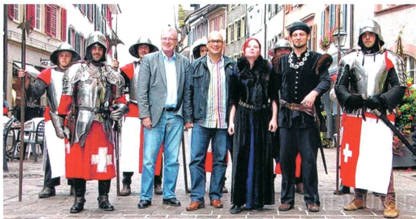
Herbstwarenmarkt am Mittelalter- spektakel

4. und 5. Oktober 2014: Zum zweiten Mal wird der traditionelle Rheinfelder Herbstwarenmarkt durch ein Mittelalterspektakel ergänzt und lockt Tausende von Besuchern in die Altstadt. Mit dem Mittelaltermarkt lebt die Geschichte der alten Zähringerstadt wieder auf. Die Ortsbürgergemeinde unterstützt die Veranstaltung mit rund 30'000 Franken.