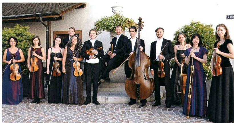
Das Rheinfelder Barock-Orchester Capriccio

22. bis 24. August 2014: Strassenkünstler, Musiker und Akkrobaten kommen nach Rheinfelden. Zum achten Mal wird das Festival «Brückensensationen» durchgeführt.