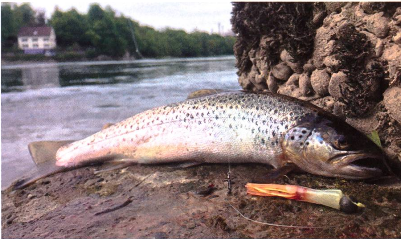
Flussforelle, gefangen im Mai 2019 in Rheinfeldern.

Es scheint, als habe es damals einfach noch nicht Littering geheissen. Heute kämpfen Fischer im ganzen Land auch mit Umwelteinflüssen, die nicht auf den ersten Blick sichtbar sind. Durch die vielen Stauhaltungen verschwinden schnell fließende und damit sauerstoffreiche