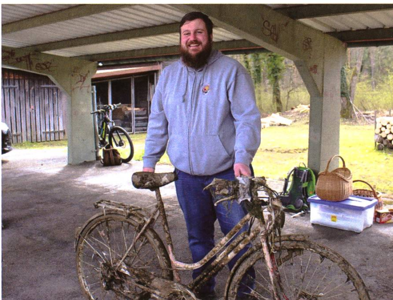
Was man nicht alles aus dem Rhein fischt: Uferputzete am 14. März 2020.

Es scheint, als habe es damals einfach noch nicht Littering geheissen. Heute kämpfen Fischer im ganzen Land auch mit Umwelteinflüssen, die nicht auf den ersten Blick sichtbar sind. Durch die vielen Stauhaltungen verschwinden schnell fließende und damit sauerstoffreiche