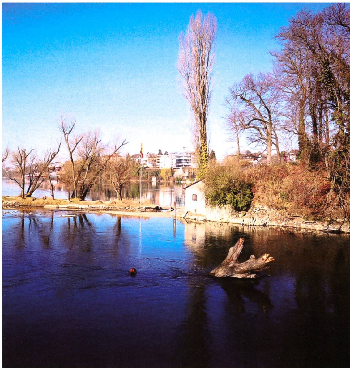
Hundert Jahre am Fluss. Das ist der Fischereiverein Bezirk Rheinfelden.

Es spricht sich herum. Im Ochs haben sie den Fischereiverein gegründet! Wir schreiben den 2. Juli 1921. Unzählige Petrijünger werden die nächsten hundert Jahre den Gründervätern folgen und damit selbst zu einem Teil dieser Geschichte. Sie lagert in einem kleinen Abstellraum beim Kraftwerk Ryburg-Schwörstadt, niedergeschrieben in Protokollen, abgelegt in einigen Bundesordnern, und bildlich festgehalten mit ein, zwei Fotoalben. Das klingt relativ unspektakulär und ist es auch. Dort, in diesem Zweckverein. Ein eigentliches Vereinslokal haben die Mitglieder des grössten Fischereivereins im Aargau nicht. Ihr Zuhause ist der Rhein. Was will man Meer.