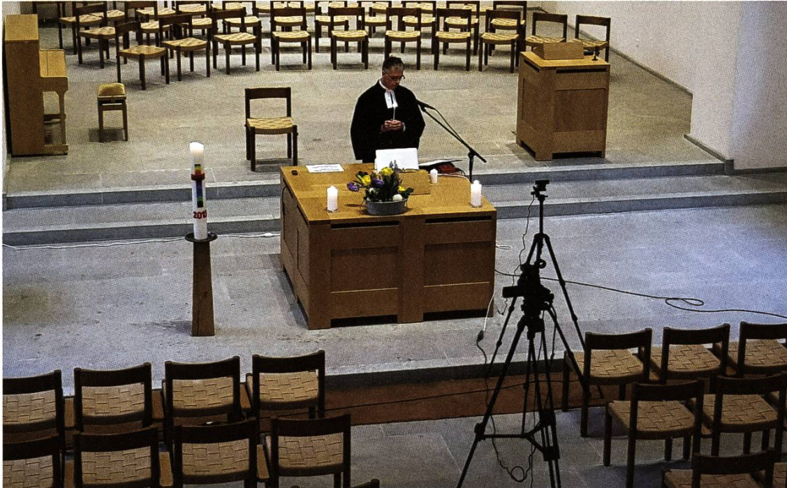
Ein Pfarrer in der leeren Kirche: Der Gottesdienst wird live übertragen.

damals grassierte die Spanische Grippe. In der Christnachtfeier in der Stadtkirche St. Martin sind die Sebastiani-Brüder zwar dabei, doch ihr Weihnachtslied wird nicht live gesungen, sondern abgespielt.