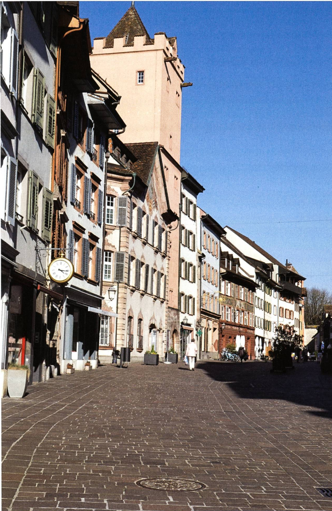
Es wurde sehr ruhig im Städtchen.