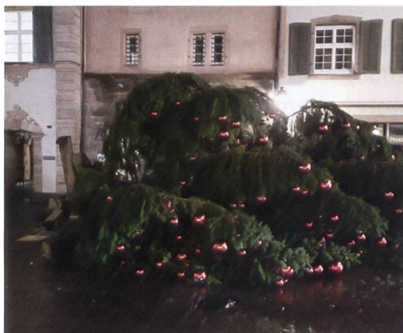
14.12.2017, der Baum vor dem Rathaus konnte dem Sturm «Zubin» nicht standhalten.