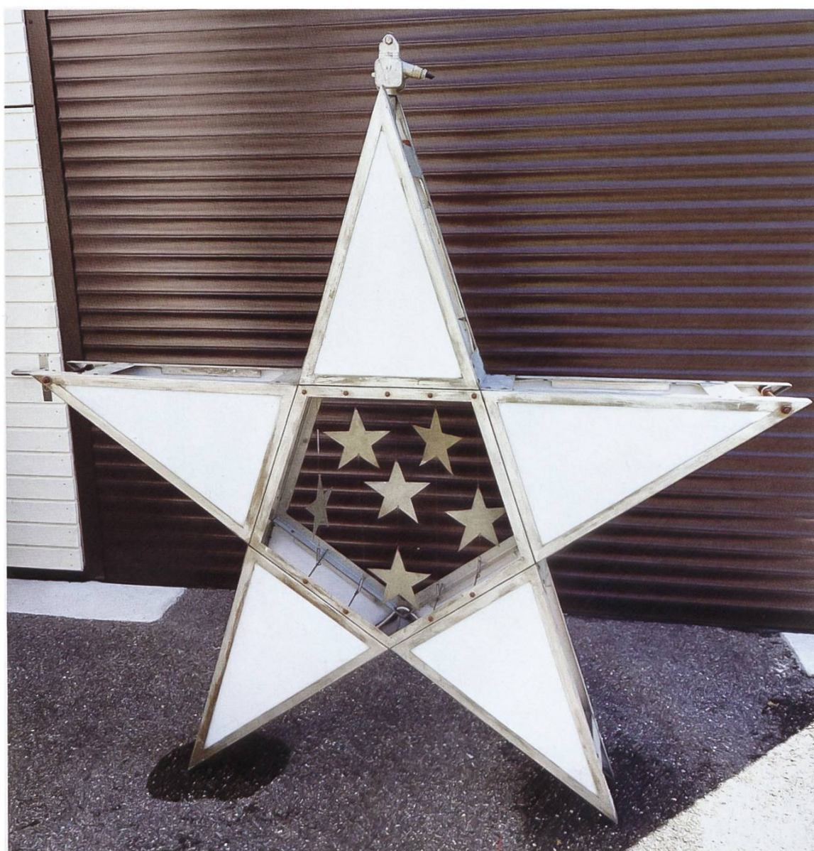
Erste Weihnachtsbeleuchtung in der Altstadt, ein Stern aus dem Jahre 1959.