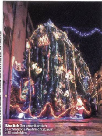
REX PHOTO AGZ, Harry Wilmanns, Gewusstes Basel, Arx, Hofstadler, Jany-Clair Gill