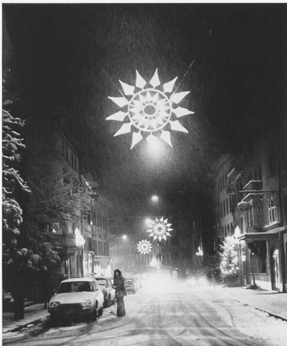
Aufnahme vom Winter 1978 mit der Weihnachtsbeleuchtung.