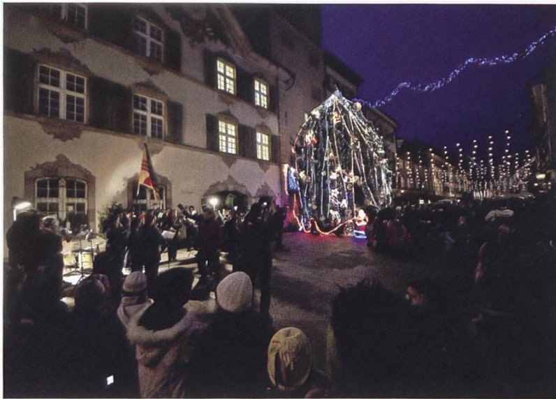
Der Baum im US – Stil 2008;