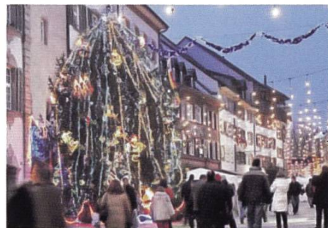
Ungewohnt. Moderner Weihnachtsbaum vor historischer Kulisse.

Bisher hat sich die Stadt Rheinfelden, die den Baum stellt, um die Dekoration gekümmert und diese mit traditionellen Kugeln und Lichterketten eher schlicht und klassisch gehalten. «Da der ursprünglich von uns geplante grosse