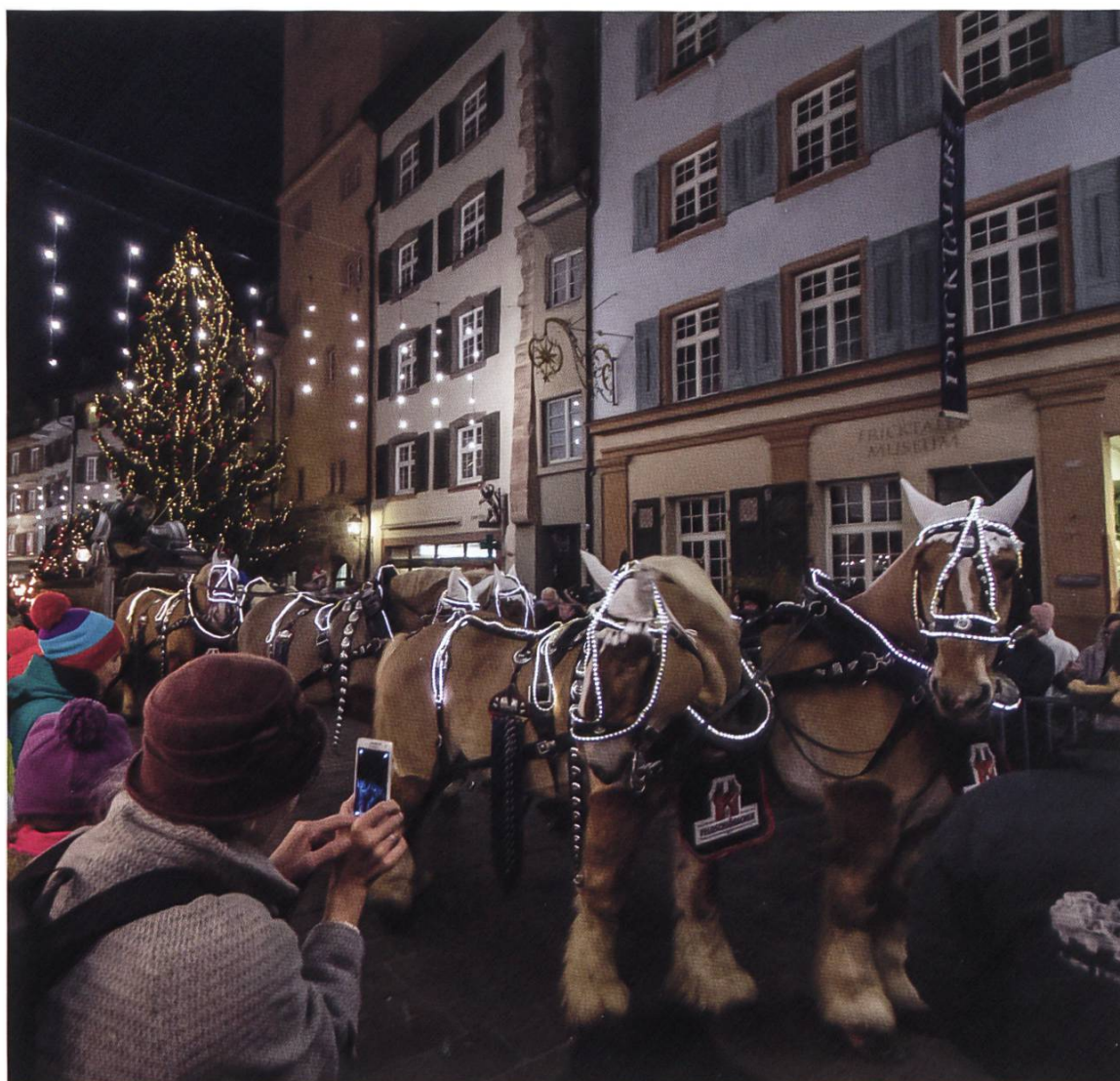
Der Sechsspänner der Brauerei bringt das Weihnachtsbier.

Das beliebte Weihnachtsfunkteln vor dem Rathaus, so es denn stattfinden kann, ist jedes Jahr der eigentliche Startschuss zur Weihnachtszeit in Rheinfelden. Diese Veranstaltung ist nicht nur für unser Städtli, sondern auch schweizweit zweifellos einzigartig schön und lockt am Freitagabend vor dem 1. Advent jeweils gegen eintausend Menschen vor das Rathaus. Der Sechsspänner aus dem Schlosstall der Brauerei Feldschlösschen mit seinen dekorierten belgischen, 900kg schweren Kaltblütern, ist allein einen Besuch wert. Rheinfelden darf sich in der Tat glücklich schätzen, vor der eigenen Haustüre ein so schönes Spektakel erleben zu dürfen. Wenn der Stadtammann vor dem Rathaus das Volk auf die Weihnachtszeit einstimmt, die Stadtmusik und die