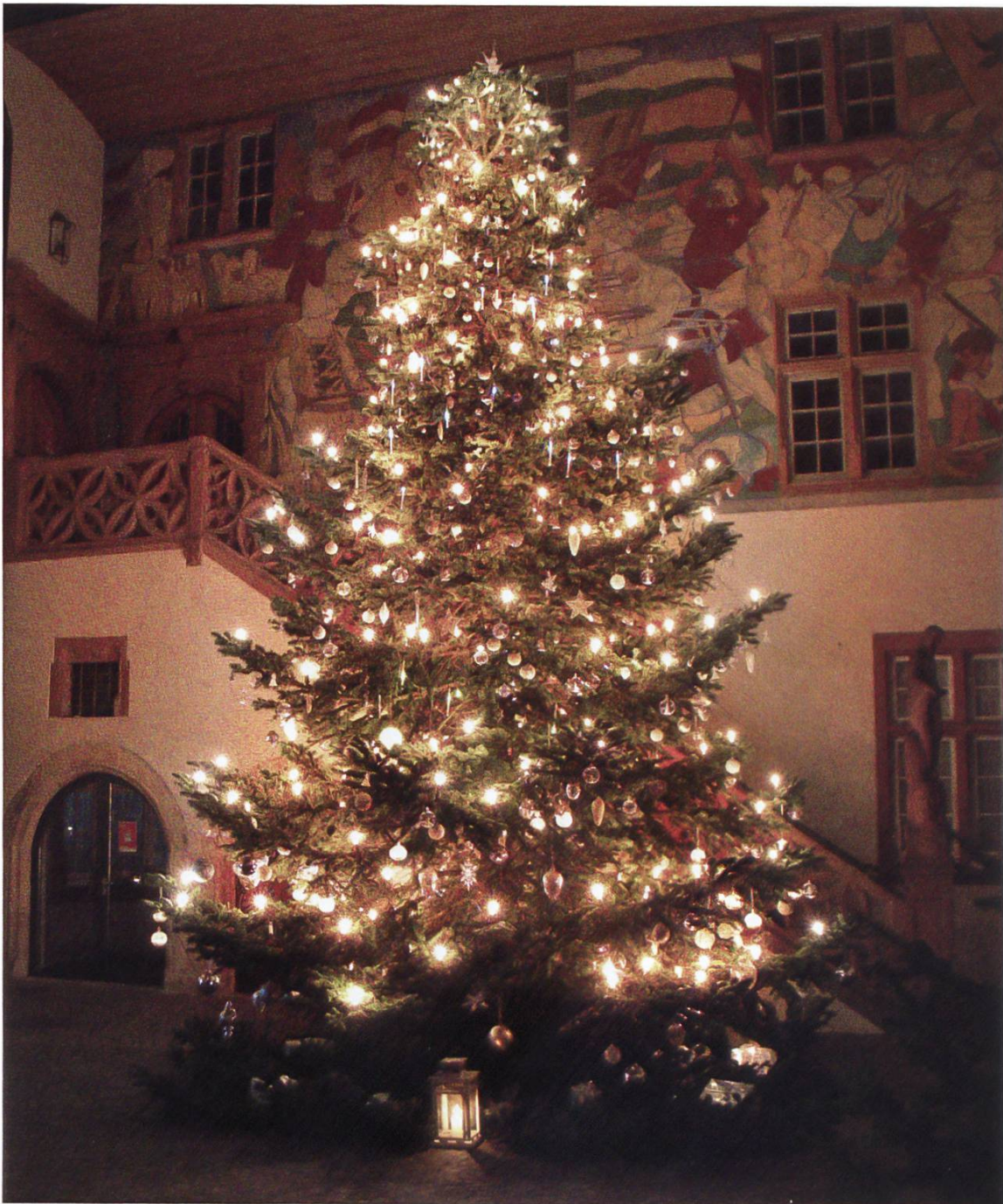
Weihnachtsbaum im Rathaushof

in Rheinfelden etwas nach und sollen auch für ein bisschen winterliche Stimmung sorgen. Die Idee dazu zündete bei einem nächtlichen Spaziergang entlang des Vierwaldstättersees, wo das Hotel Seeburg den gesamten Hotelkomplex zur Weihnachtszeit mit diesen Snow Drops schmückt. Die Unterschrift des baumschmückenden «Künstlers» findet sich am Baum, immer etwas versteckt, in Form einer FCB Kugel, die darf auf keinen Fall fehlen.