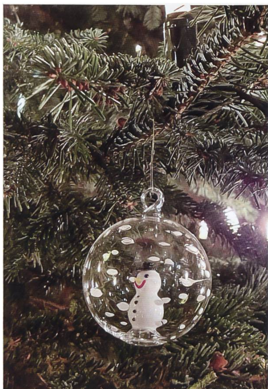
Die Weihnachtskugeln von Glasbläser Wilfried Markus