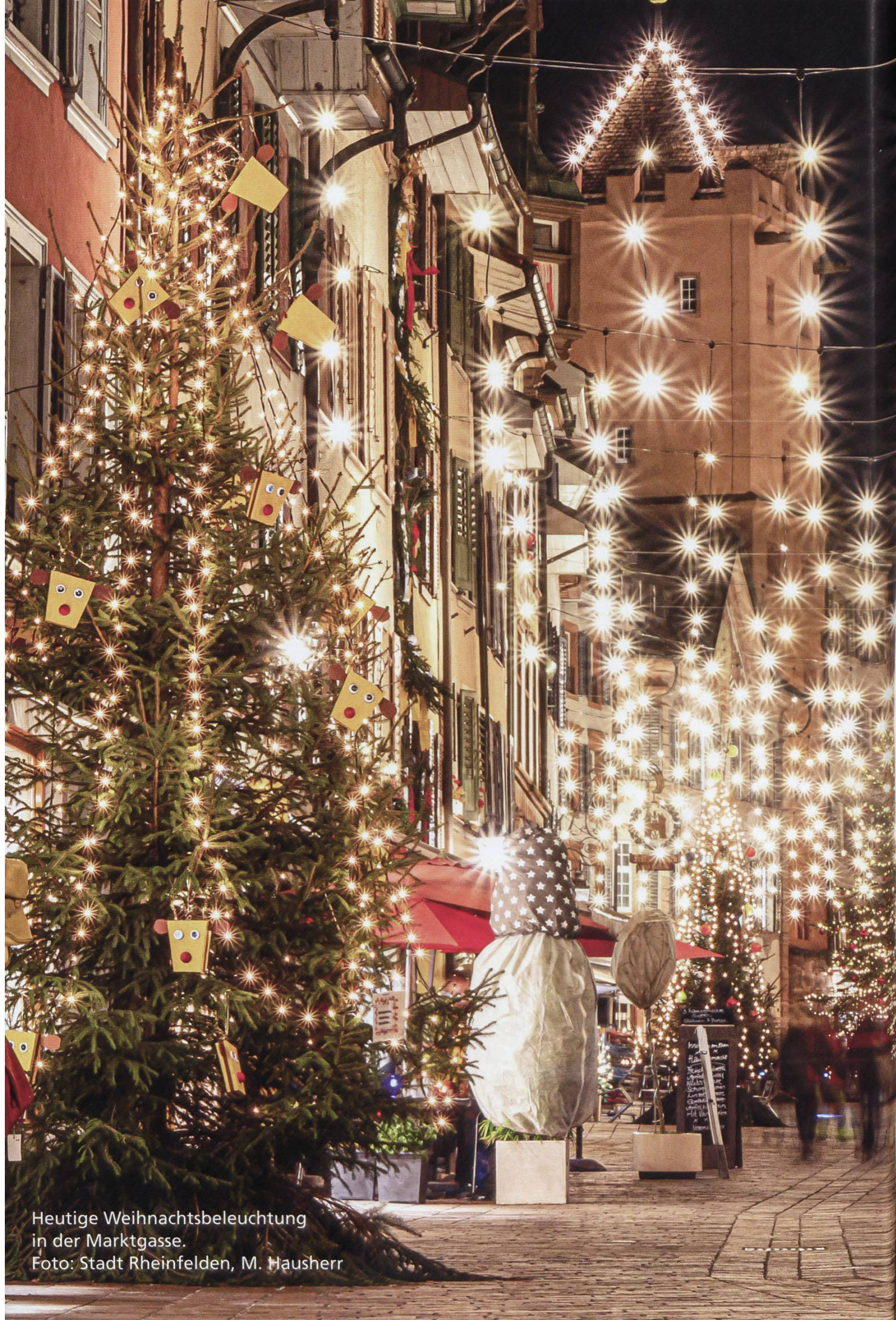
Heutige Weihnachtsbeleuchtung in der Marktgasse.