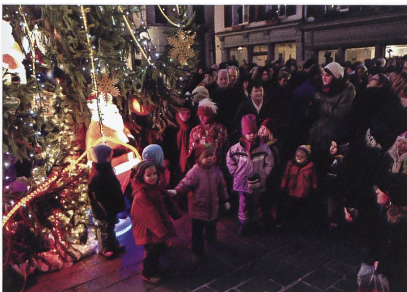
Die Kinder hatten ihre Freude daran.