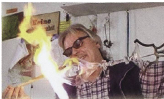
Glasbläser Wilfried Markus bei der Arbeit.

Nicht zuletzt sind es die sogenannten Snow Drops, welche am Baum mit einem Spezialeffekt noch für etwas Bewegung sorgen. Die nur langsam fallenden Tropfen verhelfen dem spärlichen Schneefall