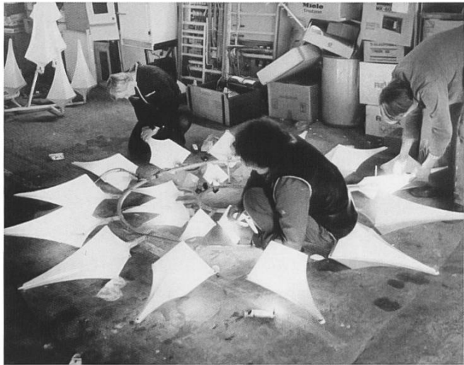
Die zweite Weihnachtsbeleuchtung wurde während rund 20 Jahren montiert.