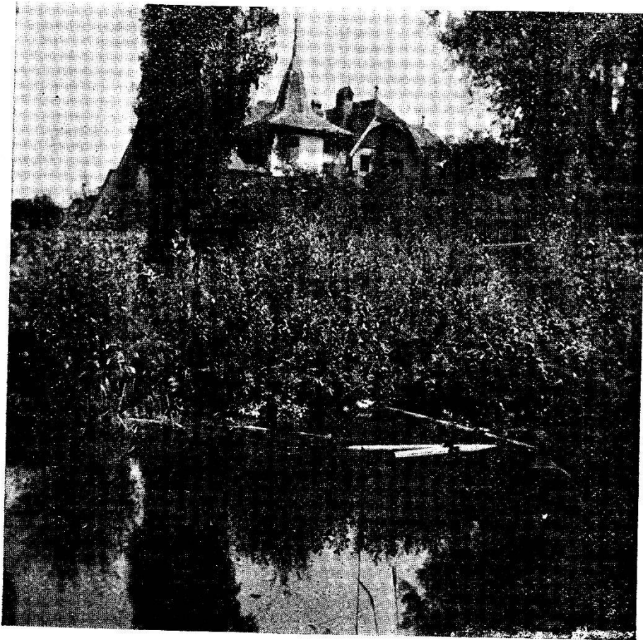
Sépey : bosquets et pièce d'eau.

Berne pour qu'elle puisse retirer et disposer de ses biens qu'elle possède rière leurs Etats et à les pouvoir librement vendre et acheter pour pouvoir fournir à sa subsistance nécessaire. Elle ne manquera pas de prier Dieu pour Vos Hauts et fleurissants Etats.