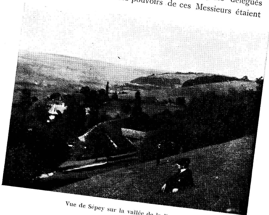
Vue de Sépey sur la vallée de la Broye.