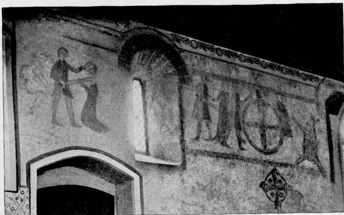
Fig. 3. — Fresques, paroi sud (XV me siècle). (appareil peint et croix de consécration, plus anciens).