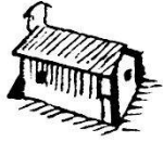
Chapelle de la Maladière

autre de 1723 (édition revue du premier), et le troisième de 1832 1 , figurent ces murailles par les croquis que voici :