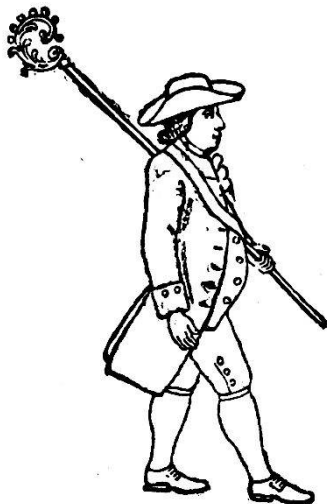
L'Abbé de la Confrérie. Fête de 1797.

personnifier la déesse Cérés. Dès lors, le nombre des personnages représentant les travaux de l'agriculture et de la vigne alla rapidement en augmentant et il fallut ajouter un orchestre qui, en 1755, comprenait huit musi-