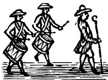
Tambours et Conseiller.

sit une partie de la ville de Vevey en 1688. Il n'en est rien. Le premier registre de procès-verbaux que la société se donna date de 1647 et il existe encore 1 . Il s'ouvre par l'inscription suivante :