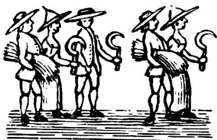
Moissonneurs et moissonneuses.

On a écrit souvent que l'ignorance dans laquelle nous nous trouvons des origines exactes de la Confrérie des vigneron proviendrait du fait que ses archives auraient été complètement consumées lors du grand incendie qui détrui-