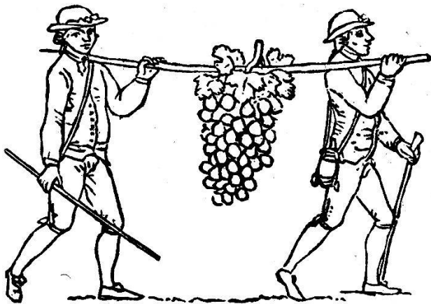
La Grappe de Canaan. — Fête de 1797.

« Le vingtième jour de juin, l'an mil six cent quarante sept, sage et prudent Chrétien Montet, sieur abbé de la vénérable Abbaye de l'agriculture de Vevey, dite de St-Urbain , en continuation de ses courtoisies et libéralités accoutumées, et de sa franche et libérale volonté, a fait pré-