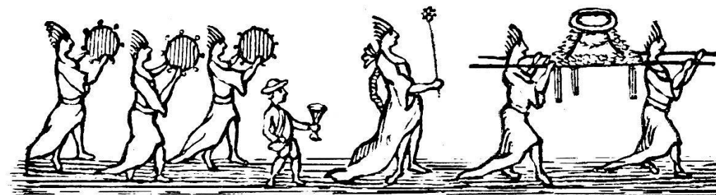
Bacchantes et autel. — Messenger Boiteux de 1778.

Le premier nom porté par l'association fut celui de Confrérie de Saint-Urbain, du nom d'un pape martyr du III me siècle. Cette circonstance nous montre que la Confrérie existait