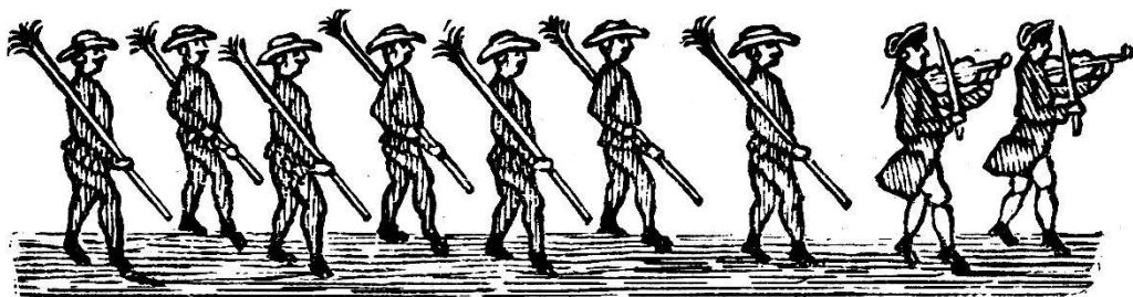
Les Faunes. — Messenger Boiteux de 1778.