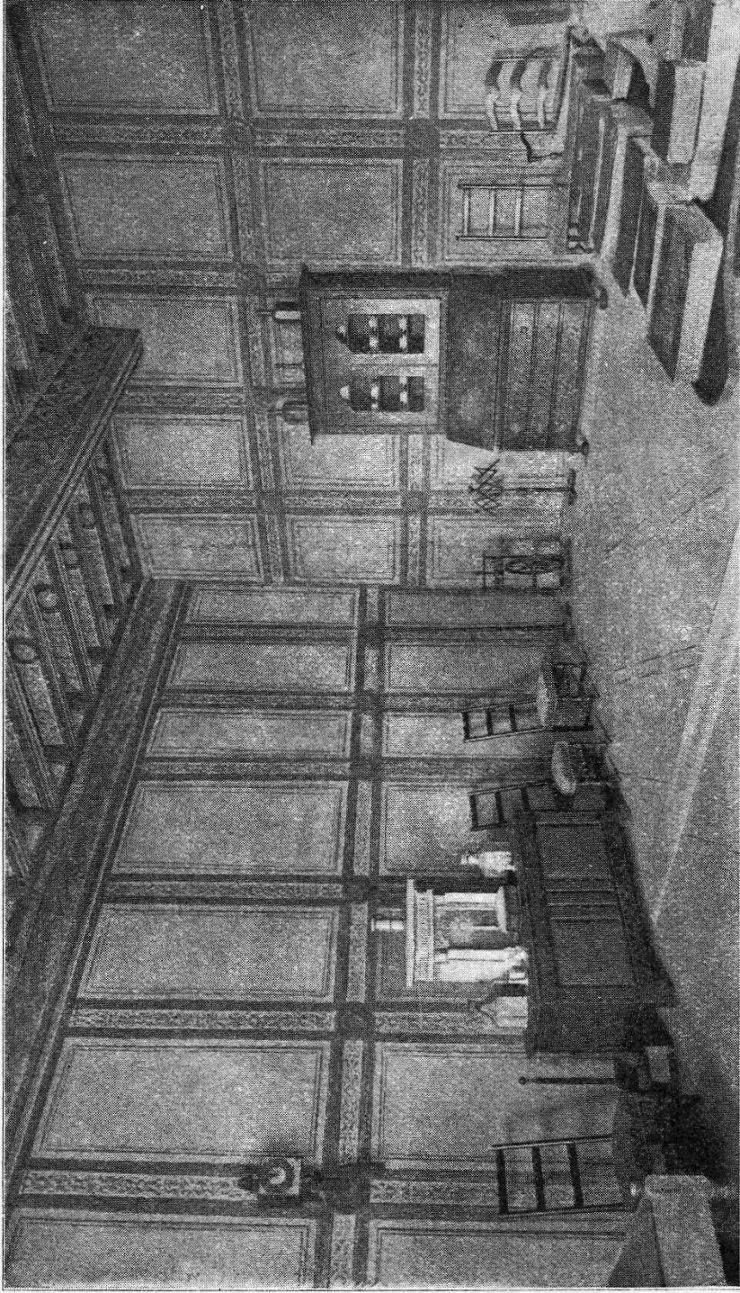
Ancienne salle de réception du prieur, puis du bailli, avec ses décorations murales restaurées par le peintre Ernest CORREVON, à Lausanne.