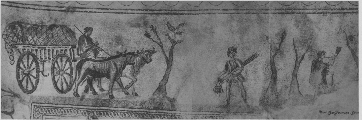
Mosaïque de Boscéaz, près Orbe (Suisse, canton de Vaud)