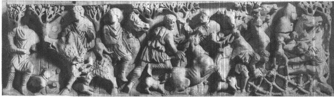
1. Chasse au lièvre