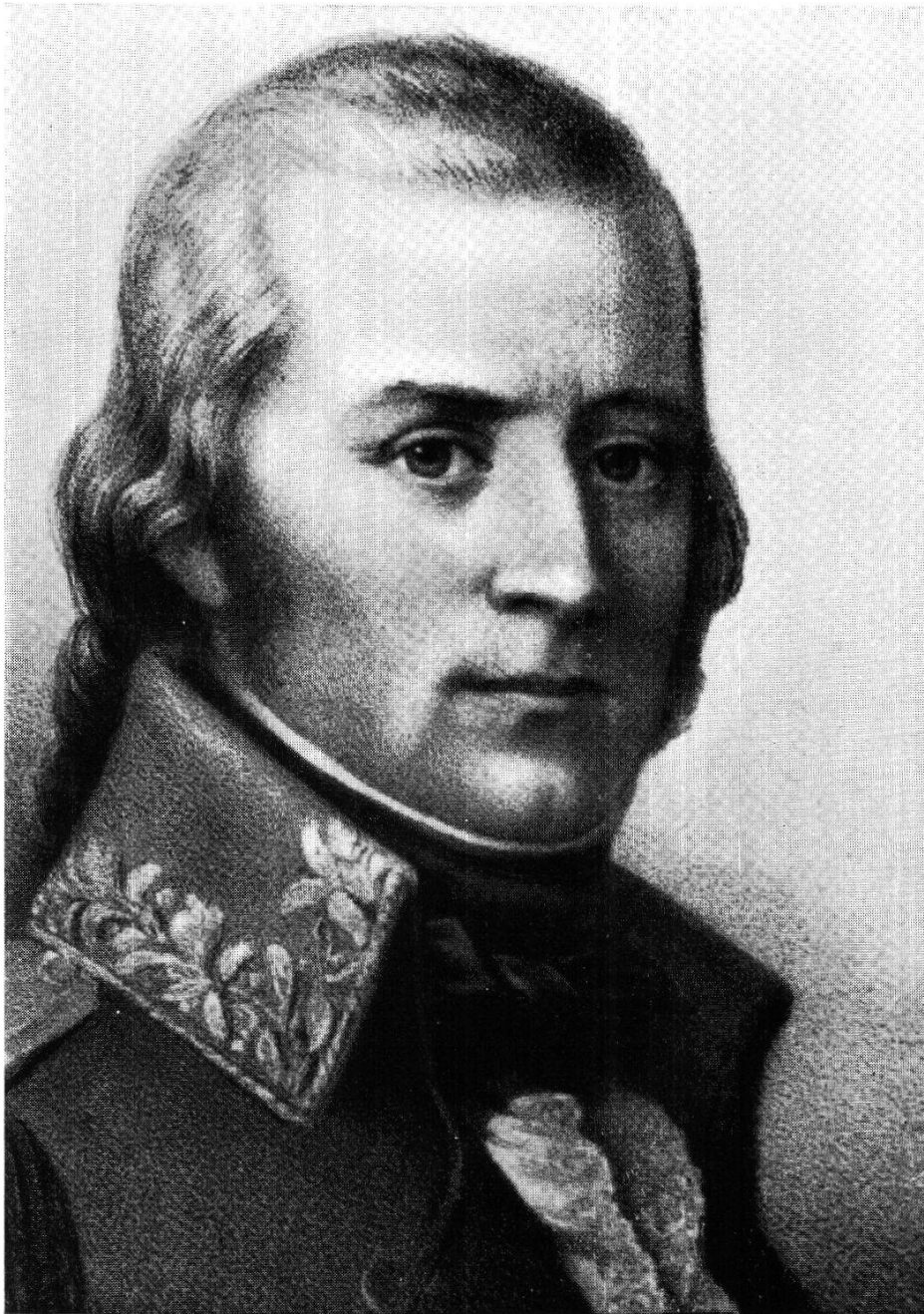
ALOYS DE REDING (1765—1818)

Le héros de Rhothenthurm 1 er landamman de la République Helvétique