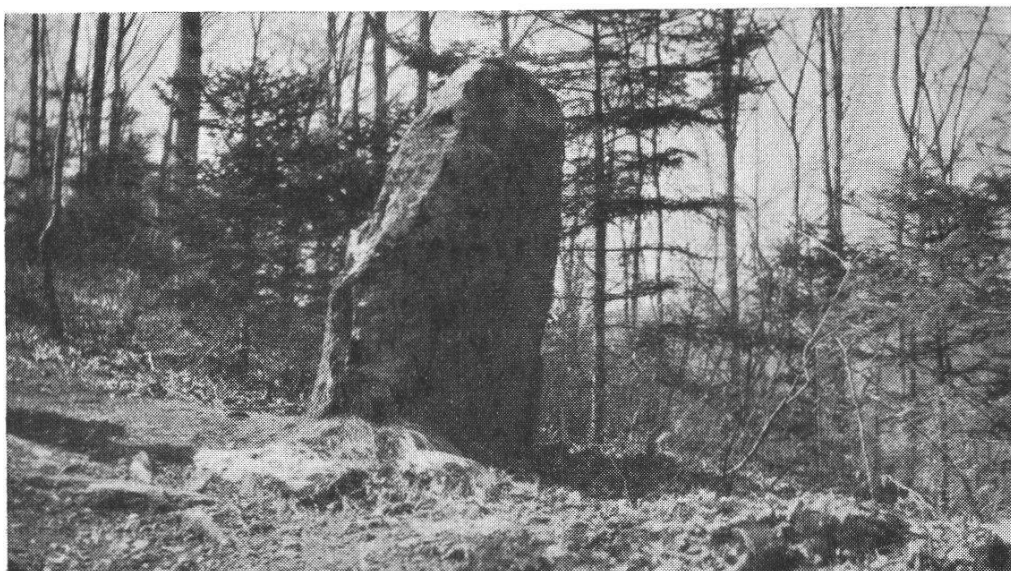
FIG. 1. — Le monument de Givrins, vu de l'est.

La bibliographie ne nous apprend rien de spécial sinon la découverte, dans la région, en 1873, de vases romains 1 .