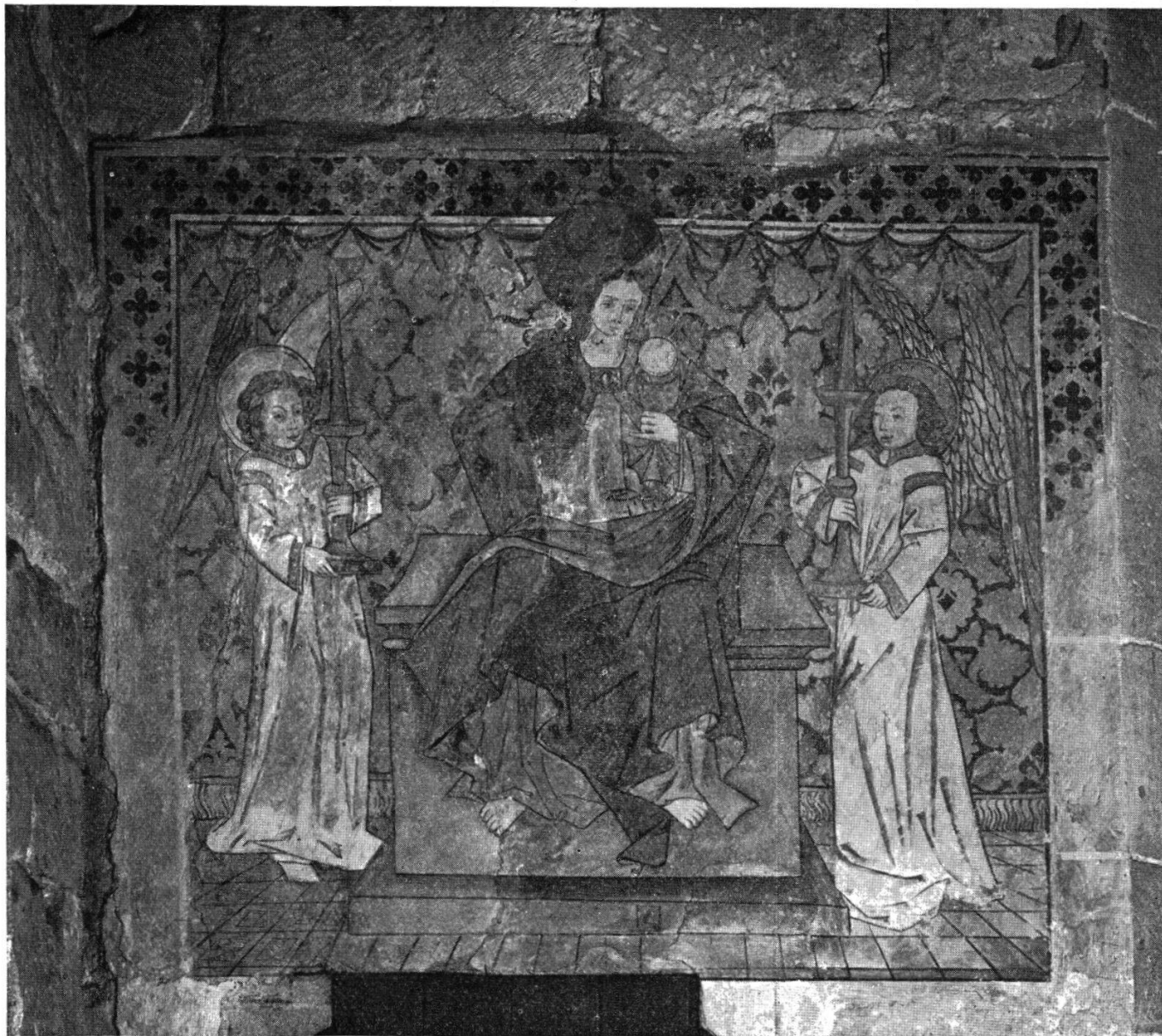
Grandson — Christ-Eucharistie