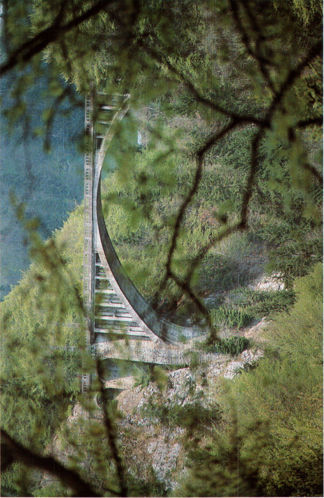
Vue du pont des Planches.