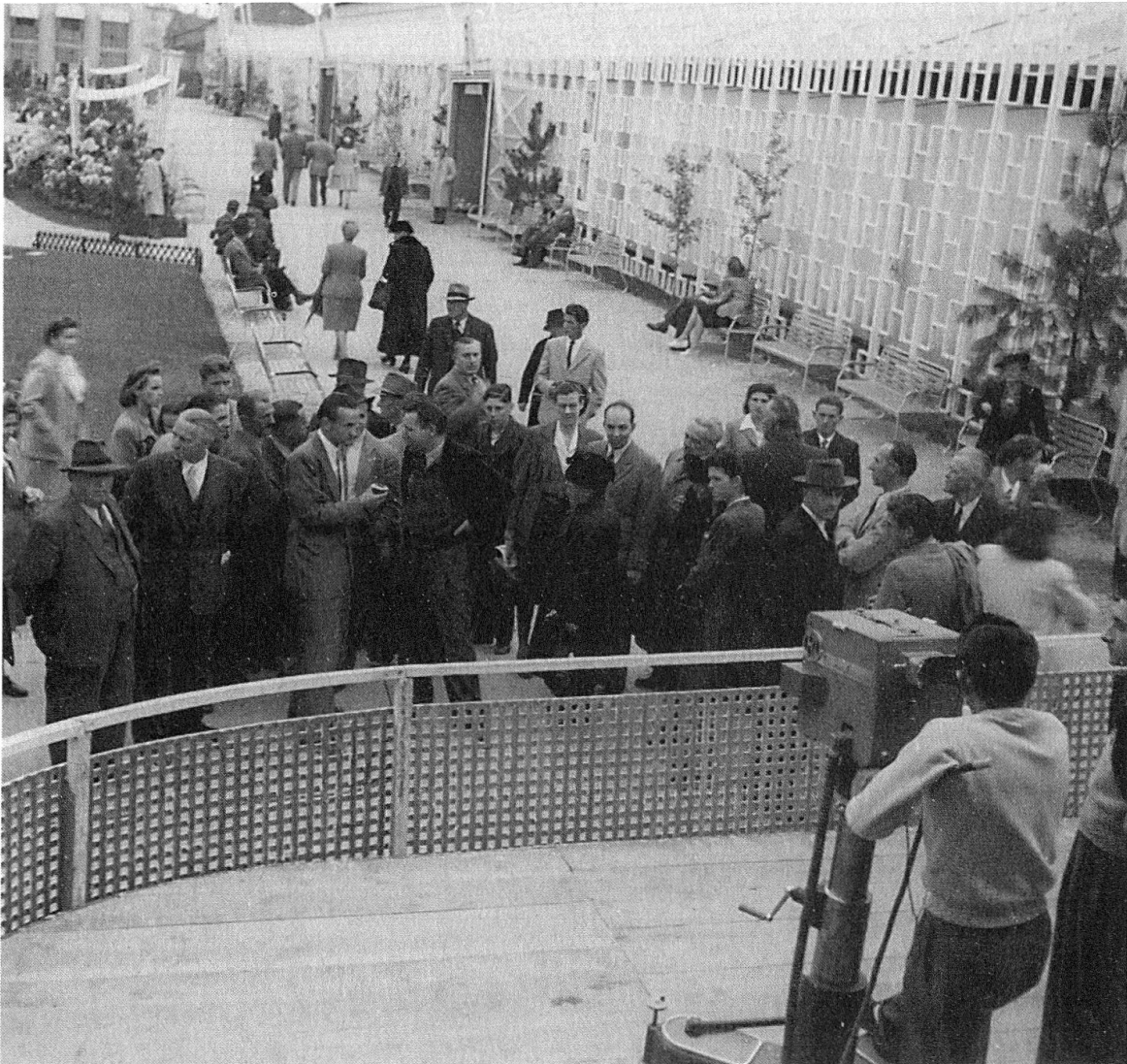
Essais et démonstrations de télévision à Lausanne, Comptoir suisse, Palais de Beaulieu, 1947