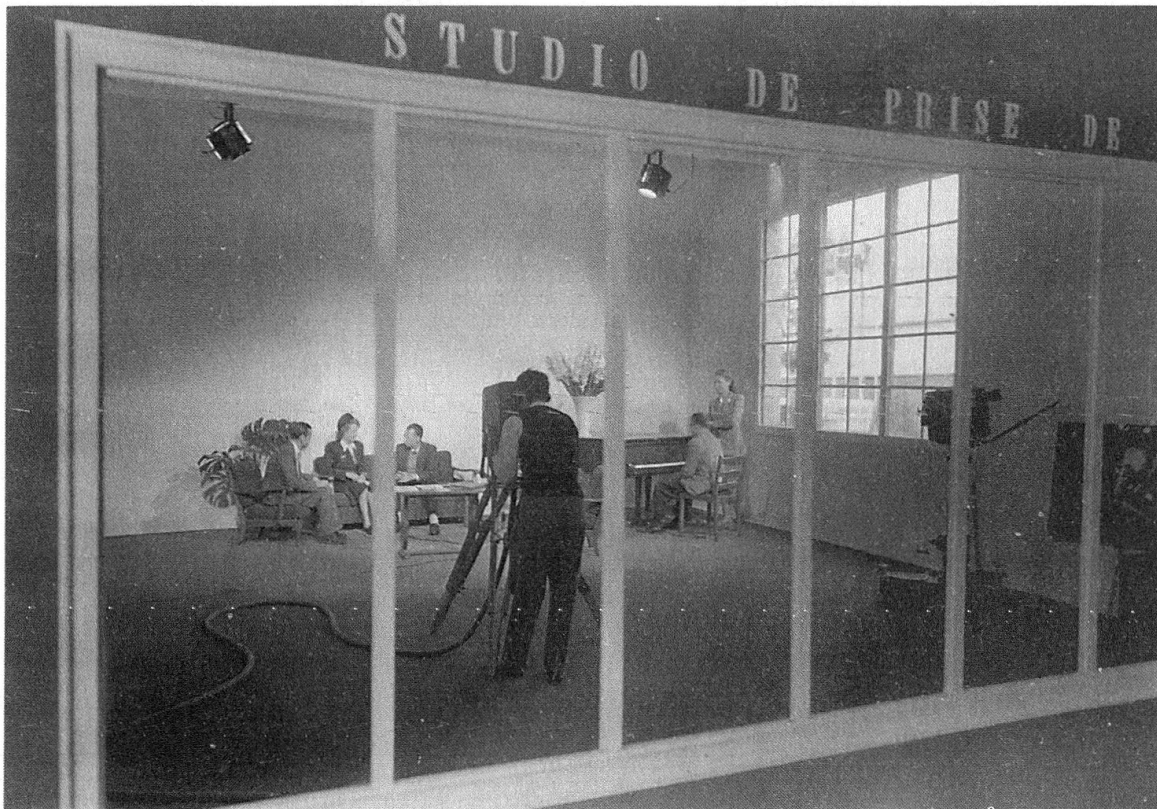
Essais et démonstrations de télévision à Lausanne, Comptoir suisse, Palais de Beaulieu, 1947

En janvier 1951, les premiers tests révèlent une mauvaise réception des ondes dues aux conditions géographiques particulières de la ville. Pour y remédier, le mât fabriqué par l'entreprise lausannoise Belet est rallongé jusqu'à trente-huit mètres 15 . Pesant quatre cents kilos, il se brise lors de l'installation sur le toit du bâtiment de la radio, début février. Les deux antennes (image et son) sont complètement détruites. Sur la base de plans envoyés par Philips, le professeur Julliard doit les reconstruire dans le plus bref délai. Le 17 février, l'installation est enfin terminée. Il ne reste alors plus qu'à régler les antennes de réception disséminées dans la ville et à terminer l'éclairage du studio.