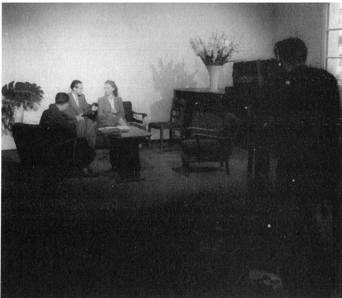
Essais et démonstrations de télévision à Lausanne, Comptoir suisse, Palais de Beaulieu, 1947