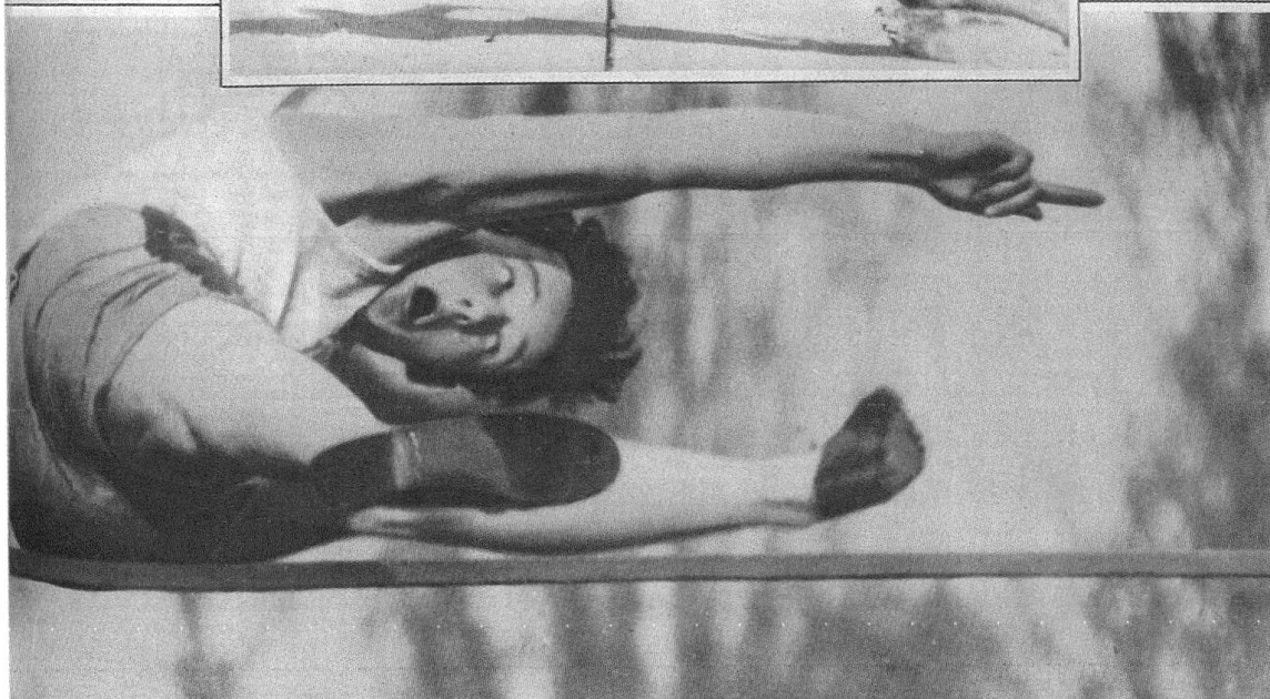
Saut en hauteur : tandis que les yeux mesurent encore l'obstacle, la bouche s'ouvre comme si ce mouvement pouvait alléger le corps tout entier.

tive : l'expression du visage au moment de l'effort suprême. — Tension, douleur, énergie, triomphe, désespoir, épuisement, toute la gamme des sentiments physiques et moraux joue, dans ces brefs instants, sur les traits du sportif. Qu'on en juge plutôt par ces quelques saisissants instantanés !